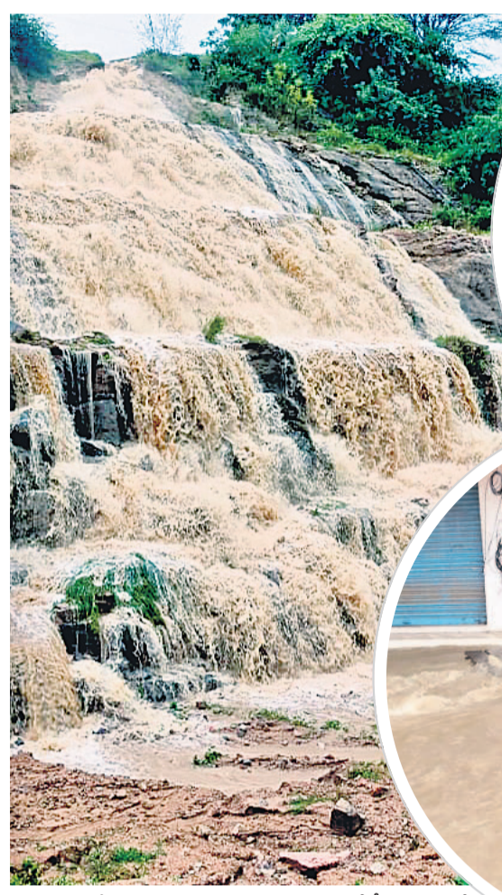
తిమ్మాజిపేట మండలం గుమ్మకొండ సమీపంలో పీఆర్ఎల్ఐలో భాగంగా తవ్విన ప్రధాన కాల్వలోకి జాలువారుతున్న వర్షపునీరు