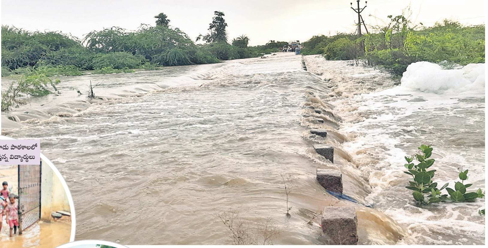
అయిజు-కర్నూల్ పెద్దవాగుపై పొంగి ప్రవహిస్తున్న వరద