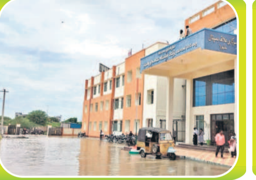
జడ్చర్ల వంద పడకల దశాబ్దాల ఆవరణలో నిలిచిన నీళ్లు