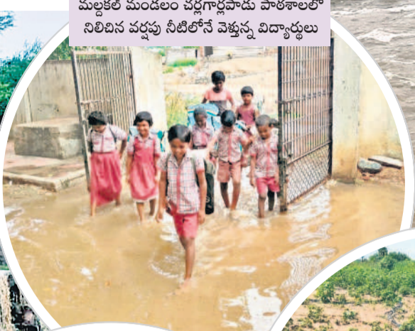
మల్లకల్ మండలం చర్లగార్లపాడు పాతశాలలో నిలిచిన వర్షపు నీటిలోనే వెళ్తున్న విద్యార్థులు