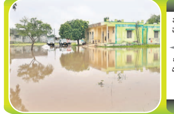
వర్షపునీరు చేరడంతో చెరువును తలపిస్తున్న అయిజు పీఠానీ