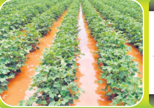
అయిజు మండలం సంకాపురం శివారులో పత్తి పంటలో చేరిన వర్షపు నీరు