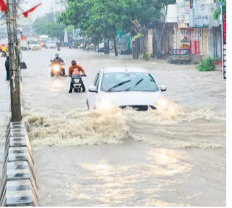
జడ్చర్లలోని ప్రధాన రహదారిపై నిలిచిన వర్షపునీటిలో వెళ్తున్న వాహనదారులు

పోలీసులు రాకపోకలను నిలిపివేయించారు. దీంతో 6 గంటల పాటు ప్రయాణికులకు నిరీక్షణ తప్పలేదు. అయిజులోని లోతట్టు కాటాన్ల జలమయమయ్యాయి. పంట పొలాలు నీటి మునిగాయి. కంది, పత్తి, పరి దెబ్బతినడంతో రైతులు అందోళన చెందారు. అయిజులో రాష్ట్రంలోనే అత్యధికంగా 133.3 మి.మీ. వర్షపాతం నమోదైంది. 14 ఏండ్లలో ఎప్పుడూ ఇంత వర్షం కురవలేదని అయిజు మండల రైతులు పేర్కొన్నారు. అయిజు పీఠానీ ఆవరణ నీటితో చెరువును తలపించింది. దశాబ్దాల వచ్చేందుకు రోగులు, సిబ్బంది తీవ్ర ఇక్కట్లు పడ్డారు. మల్లకల్ మండలం చర్లగార్లపాడు ప్రాథమిక పాఠశాల ఆవరణలో నీరు నిలవడంతో విద్యార్థులు, ఉపాధ్యాయులు అలాగే వెళ్లారు. అలాగే జడ్చర్ల మండలంలో భారీవర్షం కురిసింది. స్థానిక డ్రైనేజీలు పొంగిపొర్లాయి. రోడ్డుకి నీరు చేరడంతో రాకపోకలకు ఇబ్బందులు తలెత్తాయి. పాతబజార్, పెద్దగుట్ట, పద్మావతీ కాల్వ, తాలూకా క్రీడ్ ప్రాంతంలోని నీళ్లు నీల కుంటు వద్ద కాల్వలోకి రావడంతో పొంగింది. దీంతో జడ్చర్ల-నాగర్లకర్నూల్ ప్రధాన రహదారిపైకి చేరడంతో సమస్యలు తీసుకువచ్చాయి. అలాగే స్థానిక ప్రభుత్వ వంద పడకల దశాబ్దాల ఆవరణను వర్షపునీరు ముంచింది.