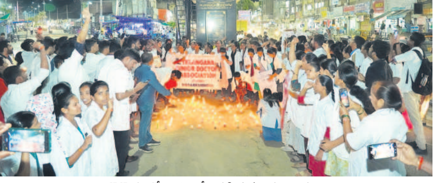
కొవ్వోతులతో శాంతిర్యాలి నిరవహిస్తున్న వైద్యవిద్యార్థులు