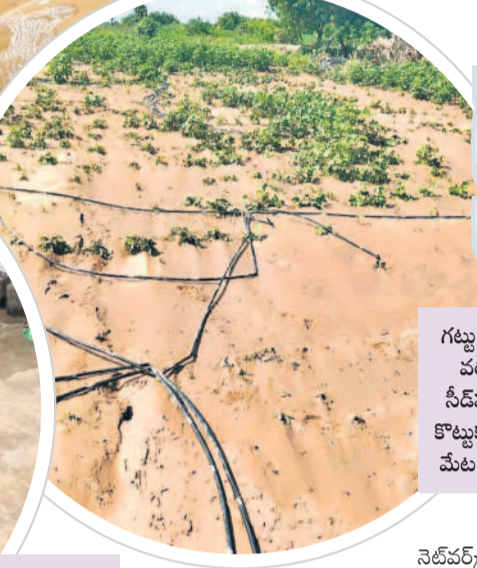
గట్టు మండలంలో వరద నీటిలో నీడపత్తి మొక్కలు కొట్టుకుపోగా ఇసుక మేట వేసిన పొలం