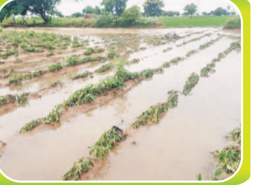
మల్లకల్ మండలంలో నీట మునిగిన కంది పంట