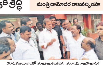
వైద్యసిబ్బంబితో మాట్లాడుతున్న మంత్రి దామోదర

ఏర్పాట్లు చేయాలని సూచించారు. రైల్వే బ్రిడ్జి పనులను వెంటనే పూర్తి చేయించాలని,