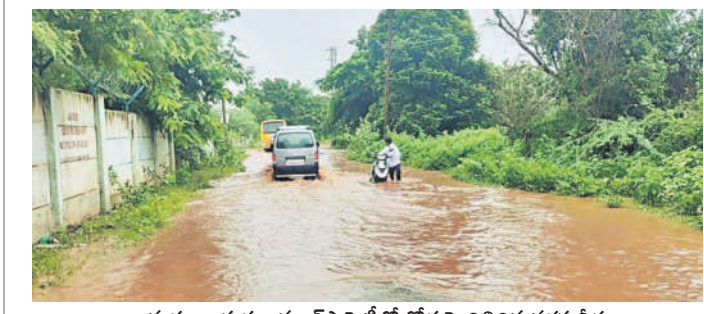
రామచంద్రాపురం: మ్యాక్స్టాప్టిలో రోడ్డుపై నిలిచిన వర్షపునీరు

వ్యాప్తంగా మంగళవారం సాయంత్రం భారీ గంటల వరకు గంటపాటు ఎడతెరిపి