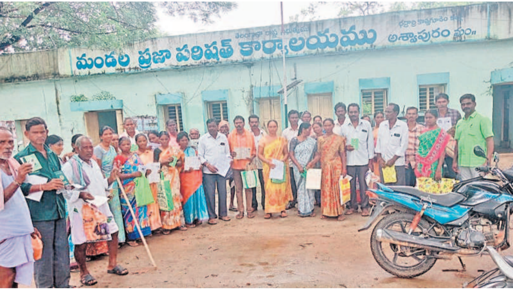
భద్రాద్రి కొత్తగూడెం జిల్లా అక్కాపూరు మండల కేంద్రంలో తమకు రుణమాఫీ వర్ధిల్లాలని కోరుతూ అధికారులకు ఫిర్యాదు చేయడానికి వచ్చిన వివిధ గ్రామాల ప్రజలు. పండుగ ఉన్నా 200మందికి పైగా రైతులు ఏవో ఫిర్యాదులు చేశారు.