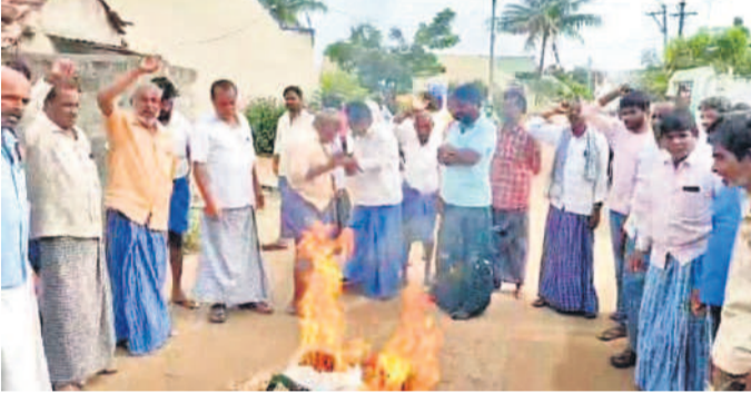
సిద్దిపేట జిల్లా అక్కాపూర్లో సీఎం రేవంత్‌రెడ్డి దిష్టిబొమ్మకు శవయాత్ర నిర్వహించారు. అనంతరం సీఎం డౌన్‌డౌన్ అంటూ నినదిస్తూ దిష్టిబొమ్మను దహనం చేశారు.