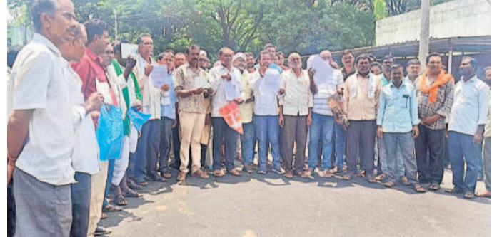
ఆదిలాబాద్ జిల్లా కేంద్రంలోని కలెక్టరేట్ కార్యాలయంలో సోమవారం జరిగిన ప్రజా వాణికి ఇంద్రవెల్లి మండల రైతులు పెద్దపెత్తున తరలివచ్చి వినతిపత్రాలు అందజేశారు.