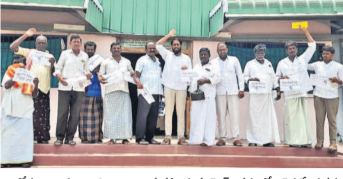
బోగోళాంబ గద్వాల జిల్లా అయిజ వ్యవసాయ మార్కెట్ అవరణలోని రైతువేదిక వద్ద జీఆర్‌ఎస్సీ అధ్యక్షులలో నిరసన వ్యక్తం చేస్తున్న రైతులు