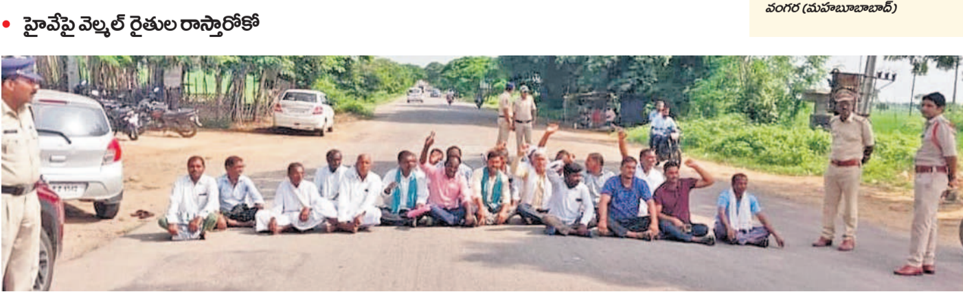
నిజామాబాద్ జిల్లా పల్వోలిలోని నందిపేట-నిజామాబాద్ ప్రధాన రహదారిపై రాష్ట్రాధికార వేస్తున్న నందిపేట మండలం వెల్లుల్లి గ్రామ పల్వోలి రైతులు. ఈ సందర్భంగా తమకు రుణమాఫీ వర్ధిల్లాలని ప్రభుత్వాన్ని డిమాండ్ చేస్తూ నిరసించారు. రుణమాఫీ చేయని ప్రభుత్వ వైఖరిని నిరసించారు.