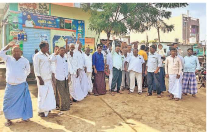
తమకు రుణమాఫీ కాలేదని ఆదిలాబాద్ జిల్లా బోధ మండలం ధన్నూరు (బి) గ్రామంలో రైతులు నిరసన ప్రదర్శన చేశారు. ప్రభుత్వ వైఖరిని నిరసించారు.