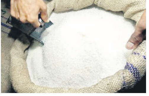
కామారెడ్డిలో బియ్యం త్రీసు హవా..

నిజామాబాద్, ఆగస్టు 19 (నమస్తే తెలంగాణ ప్రతినిధి) ఉమ్మడి జిల్లాలో పీడిషన్ బియ్యం దండా జోరుగా సాగుతున్నది. నిరుపేదల కడుపులు నింపాలన్న బియ్యం సరిహద్దులు దాటిపోతున్నది. కనిపించని నిఘా, అధికారుల నిర్లక్ష్యం వైఖరి మూలంగా అక్రమార్కులకు అడ్డే లేకుండా పోయింది. నిజామాబాద్, కామారెడ్డి జిల్లాల్లోని కీలక ప్రాంతాలే అడ్డాగా ఉచిత బియ్యం దండా అడ్డుఅడుపు లేకుండా కొన సాగుతున్నది. పేదల కోసం నిర్దేశించిన రేషన్ బియ్యాన్ని ఉభయ జిల్లాల్లోని కీలకమైన రైస్ మిల్లులకు చేరుతున్నాయి. అక్కడ పీడిషన్ బియ్యాన్ని పాల్షెడ్ పట్టి సన్నబియ్యంగా మార్చి మార్కెట్ కు తరలించి సాగుతున్నాయి. మరోవైపు, సీఎంఆర్ రూపంలో ప్రభుత్వాన్ని అక్రమార్కులకు కొందరు అధికారులు మద్దతుగా నిలుస్తున్నారు. అక్రమాలను అరికట్టేందుకు నియమించిన డిప్యూటీ తహసీల్దార్లు ఉత్సవ విగ్రహాల్లాగా మారారు. ముప్పాళ్లూ తనిఖీలే లేకుండా పోయాయి.