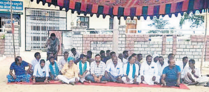
అర్బుల్ మండలం దేగాం గ్రామంలోని తెలంగాణ గ్రామీణ బ్యాంక్ ఎదుట నిరసన తెలుపుతున్న రైతులు

రుణమాఫీ కోసం రైతులు లోడ్లెక్కారు. మాకెందుకు మాఫీ కాలేదని ఆందోళనలకు దిగారు. సోమవారం నిజామాబాద్, కామారెడ్డి జిల్లాలోని పలు ప్రాంతాల్లో అన్నదాతల ధర్నాలు, ఆందోళనలు మిన్నంటాయి. అంక్షల్లేకుండా రుణమాఫీ అమలు చేయాలని డిమాండ్ చేస్తూ నిరసనలు చేపట్టారు. పాల్నా సాస్ట్రోని రైతులు ముట్టడించారు. నందిపేట్ మండలం వెల్లూర్లో అన్నదాతలు రాస్తారెకో చేశారు. మాడు జాబితాలోనూ తమ పేరు లేదని ఆవేదనకు లోనైన రైతులు మంగళవారం సిండికేట్ బ్యాంకు ఎదుట ఆందోళనకు దిగారు. దేగాంలోని బ్యాంక్ ఎదుట రైతులు టింట్ వేసుకుని బ్రాహ్మణులను పట్టణ మండలం పెద్ద రాంపూర్లోనూ రైతులు నిరసన చేపట్టారు.