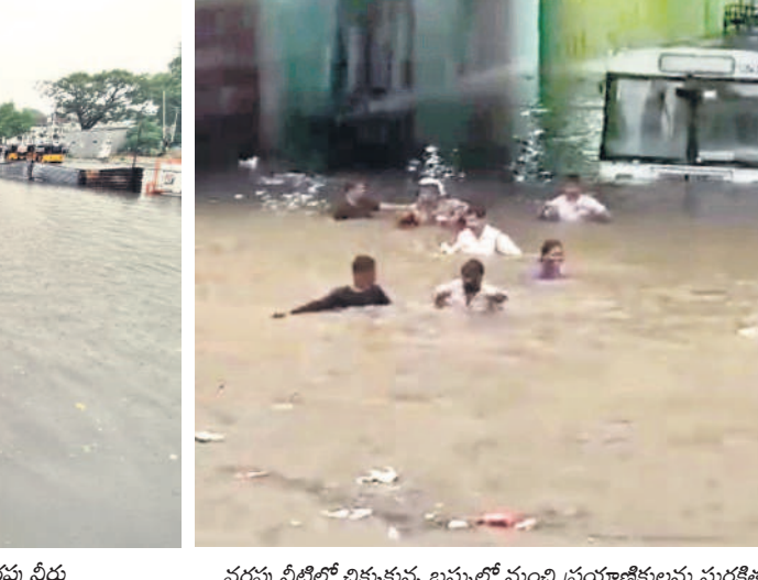
వర్షపు నీటిలో చిక్కుకున్న బస్సులో నుంచి ప్రయాణికులను సురక్షితంగా బయటికి తీసుకువచ్చుతున్న స్థానికులు