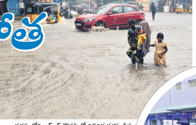
నగరంలోని ఆర్ఆర్ వార్డులో నిలిచిన వర్షపు నీరు

ఖిల్వాడి/కామారెడ్డి, ఆగస్టు 19: ఉమ్మడి నిజామాబాద్ లో సోమవారం కురిసిన భారీ వర్షం కురిసింది. గంటన్నర పాటు కురిసిన జడివానకు ఇందూరు వణికి పోయింది. లోతట్టు ప్రాంతాలు జలమయం కాగా, జన జీవనం స్తంభించింది. రోడ్లు, డ్రైయింపు ఏకమై ప్రవహించాయి. మోకాలి లోతు వరకు చేరిన నీటితో ట్రాఫిక్ స్తంభించింది. రైల్వే అండ్ లోడ్ ట్రాక్ వద్ద భారీగా నిలిచిన వరద నీటిలో అట్టిన బస్సు చిక్కుకు పోయింది. నీటి ఉధృతిని గమనించిన డ్రైవర్ ముందుకెళ్లడంతో బస్సు స్కీల్ లోనే నిలిచి పోయింది. సగం మేర బస్సు నీటిలో మునిగిపోవడంతో ప్రయాణికులు భయాందోళనకు గురయ్యారు. ఈత వచ్చినప్పటికీ బయటకు దూకి ప్రాణాలు కాపాడుకోగా, మహిళలు, చిన్నపిల్లలు బస్సులోనే చిక్కుకుపో