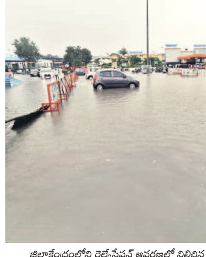
జిల్లాకేంద్రంలోని రైల్వే స్టేషన్ ఆవరణలో నిలిచిన వర్షపు నీరు