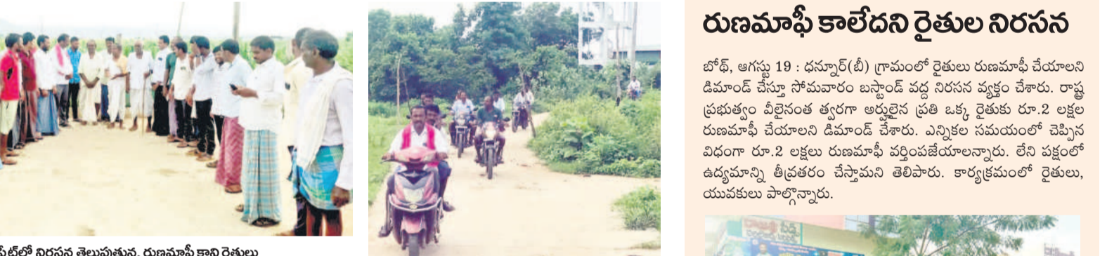
సోమవారం నిరసన తెలుపుతున్న రుణమాఫీ కాని రైతులు

శాపంగా మారిన నిబంధనలు రుణమాఫీ విషయంలో ప్రభుత్వం విధించిన నిబంధనలు శాపంగా ముయ్యారు.