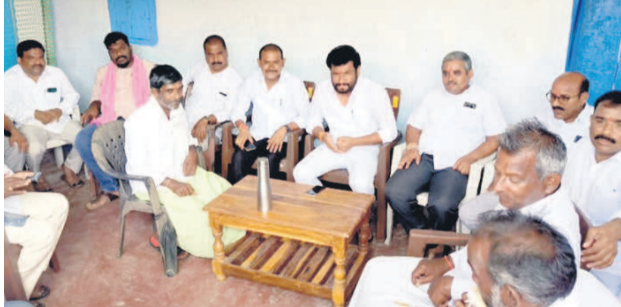
అనిల్ జాదవ్ అంతరంగం ఇంటికి వచ్చి రైతులతో మాట్లాడుతున్న బోధ్ ఎమ్మెల్యే అనిల్ జాదవ్

కలెక్టర్ కు ఫిర్యాదు ఎదులాపురం, ఆగస్టు 19 : కాంగ్రెస్ ప్రభుత్వం రుణమాఫీ చేస్తున్న తమకు మాత్రం ఇప్పటివరకు రూపాయి కూడా మాఫీ కాలేదని ఇంప్రెస్సివ్ మండలంలోని ధనోర(బి) గ్రామ రైతులు నిరసన వ్యక్తం చేశారు. సోమవారం కలెక్టరేట్ లోని సమావేశ మందిరంలో కలెక్టర్ రాజ్ కుమార్ కలిసి వివరాలను అందించారు. గ్రామంలో రైతుల వివరాలను సేకరించాలని కలెక్టర్ ఆదేశించారు.