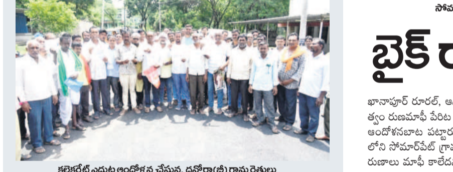
కలెక్టరేట్ ఎదుట ఆందోళన చేస్తున్న ధనోర(బి) గ్రామ రైతులు

కలెక్టర్ కు ఫిర్యాదు ఎదులాపురం, ఆగస్టు 19 : కాంగ్రెస్ ప్రభుత్వం రుణమాఫీ చేస్తున్న తమకు మాత్రం ఇప్పటివరకు రూపాయి కూడా మాఫీ కాలేదని ఇంప్రెస్సివ్ మండలంలోని ధనోర(బి) గ్రామ రైతులు నిరసన వ్యక్తం చేశారు. సోమవారం కలెక్టరేట్ లోని సమావేశ మందిరంలో కలెక్టర్ రాజ్ కుమార్ కలిసి వివరాలను అందించారు. గ్రామంలో రైతుల వివరాలను సేకరించాలని కలెక్టర్ ఆదేశించారు.