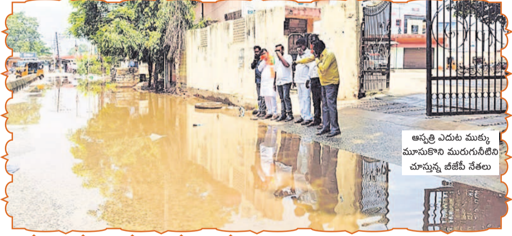
ఆస్పత్రి ఎదురు ముక్కు మారుకొని మురుగునీటిని చూస్తున్న బీజేపీ నేతలు

వెరిగి పచ్చదనాన్ని పంచుతున్నాయి. మంచాల మండలం లోని జూపాల నుంచి మంచాల, అరుట్ల నుంచి పీసీ తండా, లింగంపల్లి నుంచి లింగంపల్లి చౌరస్తా, చాండ్రానగూడ నుంచి అరుట్ల వరకు ఎటు చూసినా రోడ్లు వెంబడి చెట్లు ఎంతో ఆహ్లాదాన్ని పంచుతున్నాయి. - మంచాల, ఆగస్టు 18