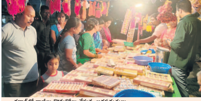
కడూల్లో రాబీలు కొనుగోలు చేస్తున్న ఆడపడుచులు

పౌరమి రోజు సోదర సోదరీమణులు అత్యంత పవిత్రంగా వారి బాంధవ్యం కల కాలం నిలవాలని జరుపుకొనే పండుగ ఇది. జీవితాంతం తోడుంటానని భరోసా ఇచ్చేది రాబీ పండుగ. పురాణాల్లో కూడా రాబీ పండుగకు ఎంతో విశిష్టత ఉన్నది. సమాజంలో మానవతా విలువలను పటిష్ఠం చేసేందుకు రోజుల్లో రాబీ పౌరమి పంటి పండుగను జరుపుకోవాల్సిన అవసరం ఎంతైనా ఉన్నది. మానవ సంబంధాలను మెరుగుపర్చడానికి ఈ పండుగ ఎంతో దోహదం చేస్తుంది. రక్షా పండుగను పుట్టిన సోదర సోదరీమణులతో కలిసి జరుపుకోవాలని ఏమీలేదు. ఏ బంధుత్వమన్నా లేకపోయినా సోదరుడు, సోదరి అన్న భావం ఉన్న ప్రతిఒక్కరూ రక్షా బంధనాన్ని కట్టే వారితోనే కలిసి జరుపుకోవాలి. అత్యున్నత మధ్య అనుబంధాలకు, ఐశ్వర్య త్యాగిని సర్వసర్వ సహకారానికి విస్తారంగా రక్షా బంధన పండుగ నిలుస్తుంది. సోదరులకు ఎప్పుడు రాబీ కడుదామని ప్రేమానురాగాలు వేయి కళ్లతో ఎదురు చూస్తుంటారు. రాబీ పండుగ రోజు ఉదయనే తలుపులు తెరిచి