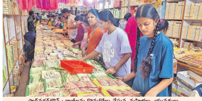
షాద్ నగర్ లో రాబీలు కొనుగోలు చేస్తున్న మహిళలు, యువతులు

పౌరమి రోజు సోదర సోదరీమణులు అత్యంత పవిత్రంగా వారి బాంధవ్యం కల కాలం నిలవాలని జరుపుకొనే పండుగ ఇది. జీవితాంతం తోడుంటానని భరోసా ఇచ్చేది రాబీ పండుగ. పురాణాల్లో కూడా రాబీ పండుగకు ఎంతో విశిష్టత ఉన్నది. సమాజంలో మానవతా విలువలను పటిష్ఠం చేసేందుకు రోజుల్లో రాబీ పౌరమి పంటి పండుగను జరుపుకోవాల్సిన అవసరం ఎంతైనా ఉన్నది. మానవ సంబంధాలను మెరుగుపర్చడానికి ఈ పండుగ ఎంతో దోహదం చేస్తుంది. రక్షా పండుగను పుట్టిన సోదర సోదరీమణులతో కలిసి జరుపుకోవాలని ఏమీలేదు. ఏ బంధుత్వమన్నా లేకపోయినా సోదరుడు, సోదరి అన్న భావం ఉన్న ప్రతిఒక్కరూ రక్షా బంధనాన్ని కట్టే వారితోనే కలిసి జరుపుకోవాలి. అత్యున్నత మధ్య అనుబంధాలకు, ఐశ్వర్య త్యాగిని సర్వసర్వ సహకారానికి విస్తారంగా రక్షా బంధన పండుగ నిలుస్తుంది. సోదరులకు ఎప్పుడు రాబీ కడుదామని ప్రేమానురాగాలు వేయి కళ్లతో ఎదురు చూస్తుంటారు. రాబీ పండుగ రోజు ఉదయనే తలుపులు తెరిచి