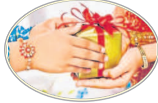
జువలకంగా భావిస్తారు. ఆడపడుచుల రాకతో తెలుగు లోగిట్లు సందడిగా మారుతాయి.

కొత్త బట్టలు ధరించి రాబీ కట్టడానికి సిద్ధమవుతారు. సోదరులకు రాబీలు కట్టే స్వల్పమైన టిని ఆ పింఛి అక్షతలు వేసి నివ్వాలి. సోదరులు సం తోషపెట్టేలా వారికి కానుకలు ఇస్తుంటారు. అందుకే ఈ రాబీ పండుగను ప్రీయమైన వారితో ముఖం జరుపుకొందాం.