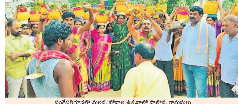
నంకేవల్లిగూడలో మల్లన్న బోసాల ఉత్సవాల్లో పాల్గొన్న గ్రామస్థులు

మేలు చేసే విధంగా జూన్, జూలై నెలల్లో వర్షాలు కురిశాయి. ఆగస్టు నెలలో మాత్రం తీవ్రమైన వర్షాభావం నెలకొన్నది. వర్షాభావ పరిస్థితుల కారణంగా వ్యవసాయం ఆటంకం పడుతుంది. వర్షాల అందోళ్లను వ్యక్తం చేస్తున్నారు. వర్షాలు కురువకుంటే భవిష్యత్తులో సాగు ప్రస్థానకామ్యాలు పెరిగి ఉంటాయి. అందుకే వర్షాలకు సాగు ప్రయత్నం చేయాలని ప్రజలు కోరుతున్నారు. ఇప్పటికే వెళ్ల వర్షాల లోని చెరువులు, కుంటల్లోకి నీరు రాలేదు. దీంతో వీటికి తీవ్ర ఆందోళన వ్యాపించింది. సాగునీరు నోచుకోలేదు. యాసగి సాగు కూడా అనుమానంగానే ఉన్నది. మున్ముందు మంచి వర్షాలు కురువాలని ప్రజలు ఆశాభావంతో ఎదురు చూస్తున్నారు.