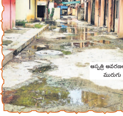
ఆస్పత్రి ఆవరణలో నిలిచిన మురుగు నీరు

తాండూరు, ఆగస్టు 18 : తాండూరు పట్టణంలోని జిల్లా ఆస్పత్రి ఆవరణ కంపు మయంగా మారింది. ఆస్పత్రి ప్రధాన గేటు తోపాటు వెనుకవైపు మురుగునీరు నిలిచిపోవడంతో ఆస్పత్రికి వచ్చేవారిలో పాలు రోడ్లపై వాహనదారులకు కూడా తీవ్ర ఇబ్బందులు తలెత్తితున్నాయి. ప్రజలు ఆరోగ్యంగా ఉంటే రోగాలు దరిచేరని చెప్పే వైద్యుల ముందే ఇంత పెద్దపెత్తున అవరణకృత నెలకొనే వాళ్లు చేసేదేమీ లేక ముక్కువే వేలేసుకొని కూర్చున్నారు. ఆస్పత్రిలో డ్రైనేజీ వ్యవస్థ అస్వస్థంగా ఉన్నప్పటికీ పాలకులు, అధికారులు పట్టించుకోవడం విడూర్చారు ఉన్నది. దీంతో ఆదివారం బీజేపీ నేతలు డ్రైనేజీ నీళ్ల దృశ్యకళ నిరసన వ్యక్తం చేశారు. అధికారులు, ప్రజాప్రతినిధులు వెంటనే స్పందించి డ్రైనేజీ వ్యవస్థను బాగు చేయాలని డిమాండ్ చేశారు.