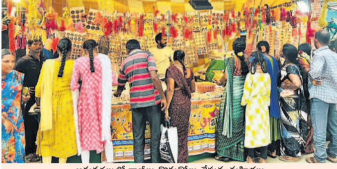
ఆమనగల్లూలో రాబీలు కొనుగోలు చేస్తున్న మహిళలు