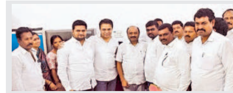
కేటీఆర్ తో చర్చా ధర్మానికి, కార్యదర్శులు

వేరుకొనాలి. ప్రతి శుభవారాన్ని డైరీగా పాటించాలి. ఇంటింటా జ్వరం వస్తే తేలికగా చెప్పాలి. ఇంటింటా జ్వరం వస్తే తేలికగా చెప్పాలి. ఇంటింటా జ్వరం వస్తే తేలికగా చెప్పాలి.