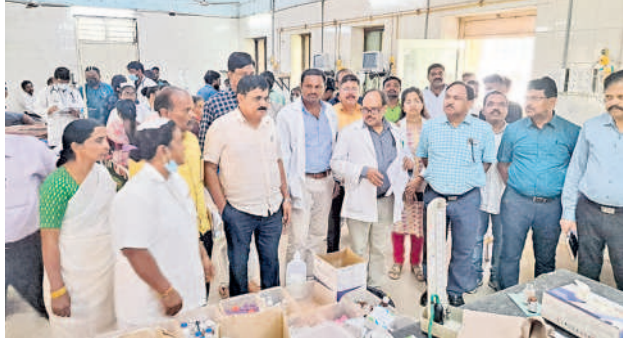
వరంగల్లో డెంగ్యూ మరణాలు నివారణ కోసం బివికార్ మందును అందుబాటులో ఉంచే వేరుకొనాలి