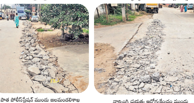
నాల్సింగి ప్రభుత్వ ఆరోగ్యకేంద్రం ముందు ఇటీవల వేసిన సీసీ రోడ్నను తవ్విన దృశ్యం

ప్రజాపతినిధుల తీరుపై స్థానికుల మండిపాటు.. ప్రజల సామ్ము వృథా చేయడంపై ప్రశ్నించాల్సిన ప్రజాప్ర