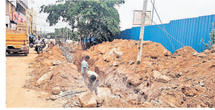
నాల్సింగి మున్సిపాలిటీ ఉర్దూమీడియం పాఠశాల ఎదురుగా అంతర్గత మురుగునీటి పైపులైన్ల కోసమని రోడ్డును తవ్వుతున్న సిబ్బంది

మణికొండ, ఆగస్టు 17 : అధికారుల మధ్య సమన్వయ లోపమా..? లేక నిర్లక్ష్యమా..? ప్రజధనం విషయంలో అధి కారులు ఆచితూచి ఖర్చుచేయాల్సి ఉండగా అవేమి పట్టనట్లు జలమండలి, మున్సిపల్శాఖ అధికారుల తీరే సెఫరేటు అన్నట్లు వ్యవహరిస్తున్నారని స్థానికులు ఆగ్రహం వ్యక్తం చేస్తు న్నారు. నార్సింగి పరిధిలో ఇటీవలే కొత్త రోడ్లువేశారు. అయితే స్థానికులు ఎంతో సంబుర పడ్డారు. కానీ ఆ సంబురం ఎక్కువ రోజులు నిలువలేదు. వేసిన సీసీ రోడ్లతో సహ అంత ర్గత మురుగునీటి వ్యవస్థ కోసమంటూ ఎక్కడపడితే అక్కడ ఇష్టాను సారంగా తవ్వేశారు. దీంతో ఈ పనేదో రోడ్డువేయక ముందే ఎందుకు చేయలేదని ప్రజలు ప్రశ్నిస్తున్నారు. కోట్లా దిరూపాయలు వెచ్చించి చేపట్టిన అభివృద్ధిపనులు మూన్నళ్ల ముచ్చటగా మార్చారని ఆగ్రహం వ్యక్తం చేస్తున్నారు.