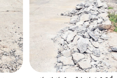
మూడు మాసాల క్రితం మున్సిపాలిటీ కార్యాలయం ముందు వేసిన సీసీ రోడ్డును తవ్వేసిన దృశ్యం