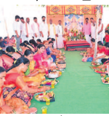
భూదాన్ పోషంపల్లి : లక్ష్మీనారాయణ స్వామి దేవాలయంలో వరలక్ష్మి సామూహిక ప్రార్థన పాల్గొన్న మహిళలు

శ్రావణమాసంలో రాఖీ పోర్ణమికి ముందు వచ్చే శుక్రవారం సందర్భంగా మహిళలు వరలక్ష్మి ప్రతాపం ఆచరించారు. ఆలయాలలో గృహిణీ ప్రత్యేక పూజలు నిర్వహించారు. భక్తిపాటలతో లక్ష్మి అమ్మవారిని కొలిచారు. కుంభమార్చనలు, అభిషేకాలు చేశారు. మహిళలు వాయిదాలు ఇచ్చిస్తున్నారంటూ ఈ సందర్భంగా జిల్లా వ్యాప్తంగా ఆధ్యాత్మిక సందడి కనిపించింది.