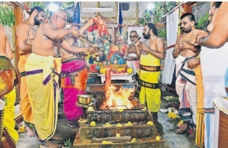
మహా పూర్ణాహుతి నిర్వహిస్తున్న అధ్యక్షులు