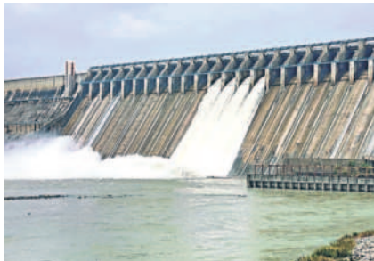
సాగర్ నాలుగు గేట్ల ద్వారా కొనసాగుతున్న నీటి విడుదల

నందికొండ, ఆగస్టు 16 : శ్రీశైలం నుంచి వరద కొనసాగుతుండడంతో నాగార్జునసాగర్ ద్వారా నాలుగు గేట్ల ద్వారా నీటిని దిగువకు విడుదల చేస్తున్నారు. శ్రీశైలం నుంచి 79,617 క్యూసెక్కుల ఇన్ఫ్లో వస్తుండడంతో అదే స్థాయిలో అవుట్ ఫ్లో కొనసాగిస్తున్నారు. శ్రీశైలం గేట్ల ద్వారా 32,400 క్యూసెక్కులు, ఎడమ కాల్వ ద్వారా 7,518, కుడి కాల్వ ద్వారా 8,067, ప్రధాన జలవిద్యుత్ కేంద్రం ద్వారా 29,232, వరద కాల్వ ద్వారా 600, ఎన్.ఎల్.బీ.సి. ద్వారా 1,800 క్యూసెక్కుల నీటిని విడుదల చేస్తున్నారు.