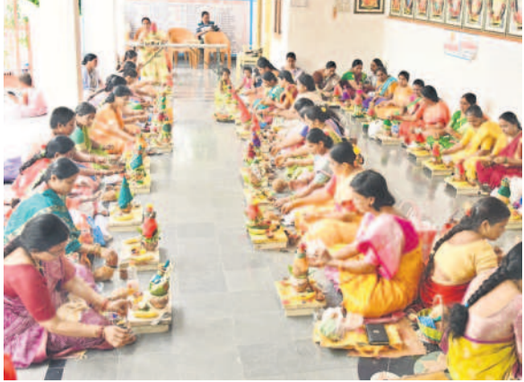
పాలమూరు వీరస్వమేల చౌడేశ్వరి ఆలయంలో ప్రత్యేక ఆచారస్థులను మహిళలు, కమలం పూలతో అమ్మవారిని అలంకరించిన దృశ్యం