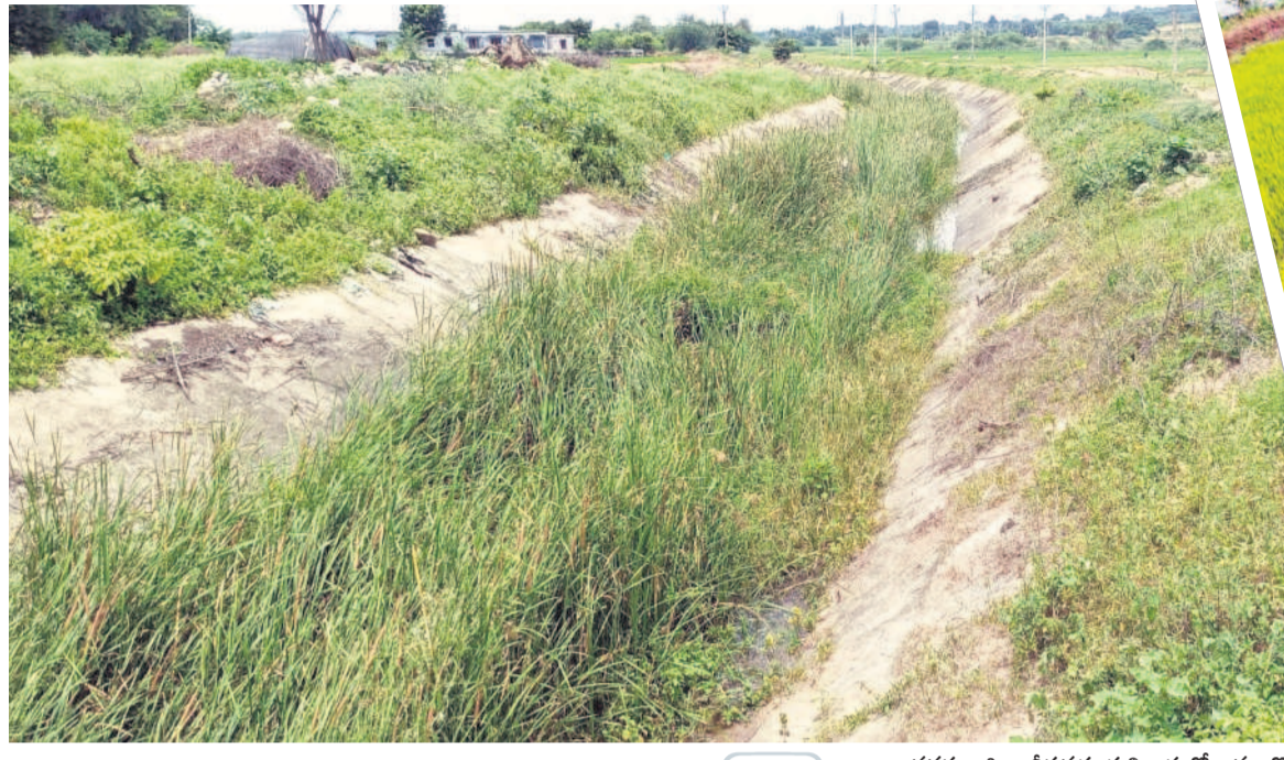
వనపర్తి జిల్లా వీరవంగడ్ల శివారులో జమ్మతో నిండుకున్న భీమా కాల్య.. (ఇలా ఉంటే నీరు పారేదెలా?)