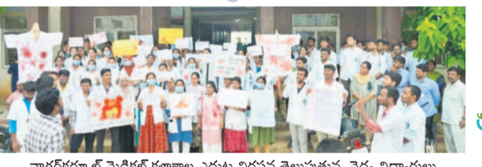
నాగర్ కర్నూల్ మెడికల్ కళాశాల ఎదుట నిరసన తెలుపుతున్న వైద్య విద్యార్థులు