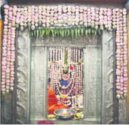
పాలమూరు వీరస్వమేల చౌడేశ్వరి ఆలయంలో ప్రత్యేక ఆచారస్థులను మహిళలు, కమలం పూలతో అమ్మవారిని అలంకరించిన దృశ్యం