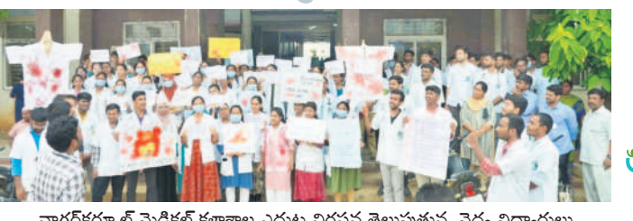
నాగర్ కర్నూల్ మెడికల్ కళాశాల ఎదుట నిరసన తెలుపుతున్న వైద్య విద్యార్థులు