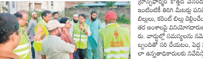
పాలమూరులో పర్యవేక్షణ విద్యుత్ శాఖ అధికారులు

సబ్ స్ట్రెప్లను ఏర్పాటు ఇలా.. మహబూబ్ నగర్ మెడికల్ కళాశాల, పాలమూరు విశ్వవిద్యాలయం, భగీరథ కాలనీ, హన్మంత పండ్ల లాల్ నీ బుద్ధారం, ఎనిమిదితండా, గండేడి, రంగారెడ్డిగూడ (రాజాపూర్), నందారం, నెల్లెపల్లి (బాలానగర్), ననరుల్లా బాద్ (జడ్పర్ల), జడ్పర్ల కబోడో, బోయినపల్లి (మిడ్లెట్),