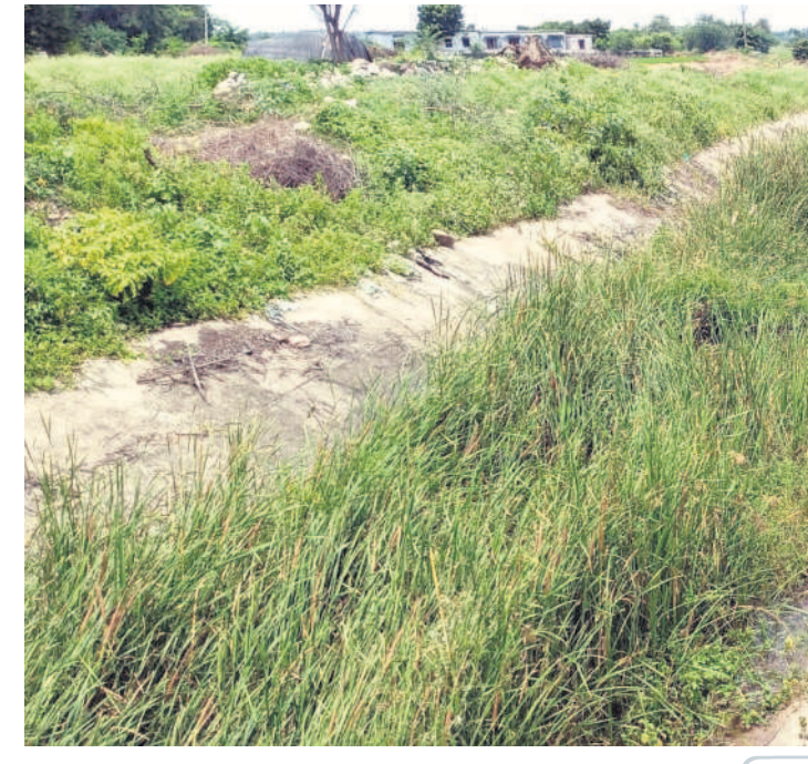
వనపర్తి జిల్లా వీరవగండ్ల శివారులో జమ్మతో నిండుకున్న భీమా కాల్య.. (ఇలా ఉంటే నీరు పారేదెలా?)

పాలమూరులో పర్యవేక్షణ విద్యుత్ శాఖ అధికారులు