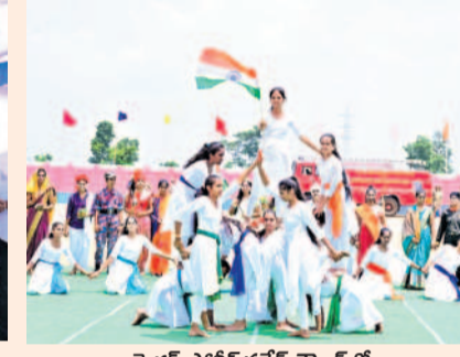
మెదక్ పోలీస్ పరేడ్ గ్రౌండ్ లో సాంస్కృతిక కార్యక్రమాల ప్రదర్శనను, విద్యార్థులు