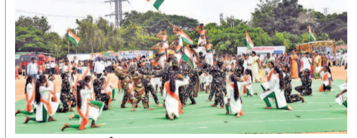
సిద్దిపేట డిగ్రీ కళాశాల మైదానంలో ఆకట్టుకున్న విద్యార్థుల ప్రదర్శన

న్యామని, త్వరలో పనులు ముగించి అభివృద్ధి ప్రారంభించనున్నట్లు తెలిపారు. సంగారెడ్డిలో రూ.250 కోట్లతో 500 పడకల దవాఖాన నిర్మిస్తున్నామని, ఈ పనులకు త్వరలోనే శంకుస్థాపన చేస్తామని చెప్పారు. మహిళలకు బ్యాంకురణాలు, స్ట్రీని రుణాలు, వడ్డీ తేని రుణాలు అందజేస్తున్నట్లు తెలిపారు. రూ.168 కోట్లతో సంగారణ కాల్యాల లైనింగ్ పనులు చేపట్టుతున్నట్లు చెప్పారు. రూ.24 కోట్లతో నల్లవార ఆధునికరణ పనులు చేపడుతున్నట్లు తెలిపారు. రూ.50 కోట్లతో ఎన్డీఆర్ నిధులతో జిల్లాలోని ఐదు నియోజకవర్గాల్లో అభివృద్ధి పనులు చేపడుతున్నట్లు చెప్పారు. శాంతిభద్రతల బరితెగకు ప్రాధాన్యత ఇస్తున్నట్లు తెలిపారు. మాదకద్రవ్యాల నిర్మూలనకు కఠిన చర్యలు తీసుకుంటున్నట్లు వివరించారు. మంత్రి దామోదర రాజనర్సింహ తన ప్రసంగంలో అంబేద్కర్, నెల్సన్ మండేలా మాటలను ఉటంకించారు. కార్యక్రమంలో కలెక్టర్ పల్లూరు శ్రాంతి, ఎస్పీ రూపేష్, డీఎన్ ఐఎస్ వైద్య నిర్వహణ, అదనపు కలెక్టర్ చండ్రాభార, మాధురి, ట్రైని కలెక్టర్ మనోజ్, సంగారెడ్డి మునిసిపల్ చైర్మన్స్ విజయలక్ష్మి తదితరులు పాల్గొన్నారు.