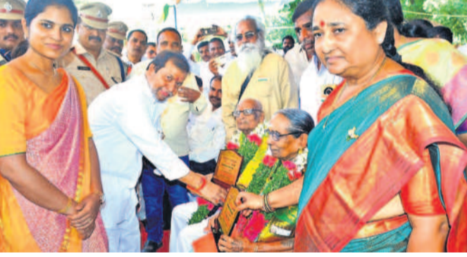
సంగారెడ్డిలో స్వాతంత్ర్య సమరయోధుల కుటుంబసభ్యులను సన్మానిస్తున్న మంత్రి దామోదర రాజనర్సింహ, కలెక్టర్ తదితరులు