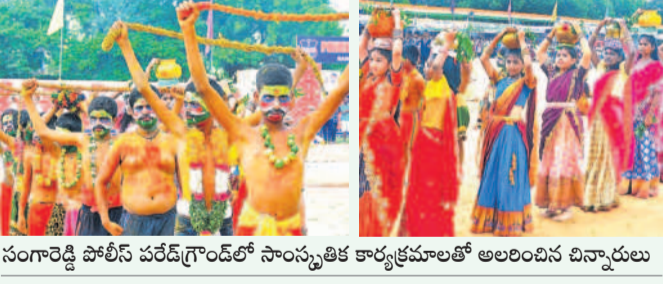
సంగారెడ్డి పోలీస్ పరేడ్ గ్రౌండ్ లో సాంస్కృతిక కార్యక్రమాలతో అలరించిన చిన్నారులు