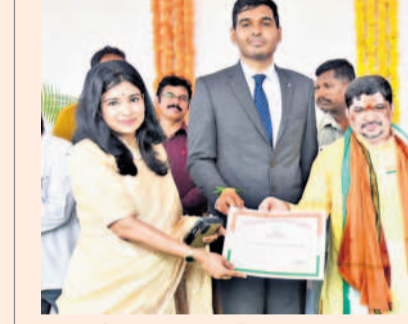
సిద్దిపేట అడిషనల్ కలెక్టర్ గంజాలగండ్లలో ప్రశంసాపత్రాలు అందజేస్తున్న మంత్రి పాన్సం ప్రభాకర్, పక్కన కలెక్టర్ మనుచౌదరి, ఎస్పీ అనురాధ