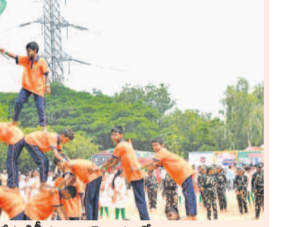
సిద్దిపేట డిగ్రీ కళాశాల మైదానంలో ఆకట్టుకున్న విద్యార్థుల ప్రదర్శన