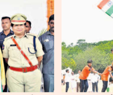
సిద్దిపేట డిగ్రీ కళాశాల మైదానంలో సాంస్కృతిక కార్యక్రమాల ప్రదర్శనను, విద్యార్థులు