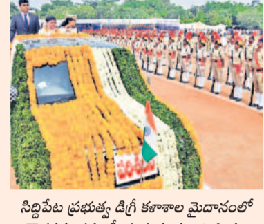
సిద్దిపేట ప్రభుత్వ డిగ్రీ కళాశాల మైదానంలో గౌరవవందనం స్వీకరిస్తున్న మంత్రి పాన్సం

సిద్దిపేట అర్బన్, ఆగస్టు 15: కాంగ్రెస్ ప్రభుత్వంలో ప్రజాపాలన, పారదర్శక పాలనతో పాటు సమాజంలో అన్ని వర్గాలకు స్పష్ట, సామాజిక న్యాయం, సమాన అవకాశాల ద్వారా అభివృద్ధి తమ ప్రభుత్వ లక్ష్యమని రాష్ట్ర రహణ, జీవీ సంక్షేమ శాఖ మంత్రి పాన్సం ప్రభాకర్ అన్నారు. గురువారం సిద్దిపేట జిల్లా కేంద్రంలోని ప్రభుత్వ డిగ్రీ కళాశాల మైదానంలో జరిగిన 78వ స్వాతంత్ర్య వేడుకల్లో ఆయన