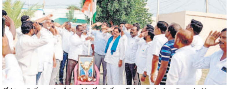
కోర్కట్ల : ఎమ్మెల్యే కాంత్ ఆఫీసు ఆవరణలో ఎమ్మెల్యే డాక్టర్ సంజయ్ కల్వకుంట్ల జెండా వందనం