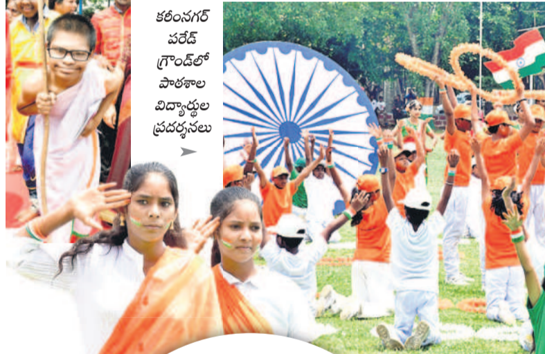
కరీంనగర్ పరేడ్ గ్రౌండ్లో పాఠశాల విద్యార్థుల ప్రదర్శనలు