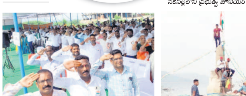
జగిత్యాలలో జెండాకు వందనం చేస్తున్న ప్రజలు