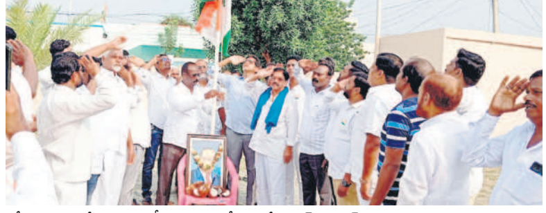
కోర్కట్ల : ఎమ్మెల్యే కాంత్ ఆఫీసు ఆవరణలో ఎమ్మెల్యే డాక్టర్ సంజయ్ కల్వకుంట్ల జెండా వందనం