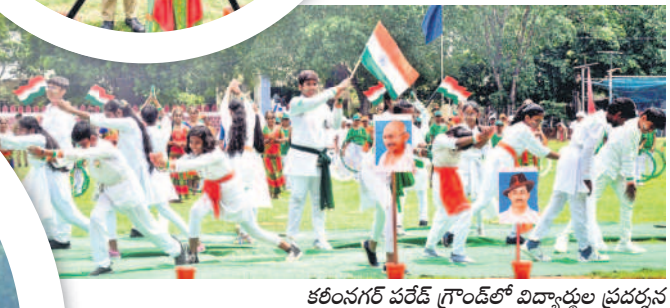
కరీంనగర్ పరేడ్ గ్రౌండ్లో విద్యార్థుల ప్రదర్శన