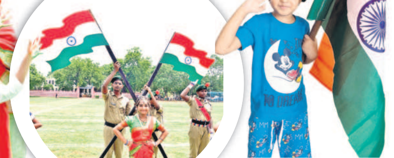
పెద్దపల్లిలో రాష్ట్ర మహిళా కమిషన్ చైర్ పర్సన్ నేరేళ్ల శారద