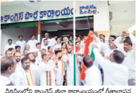
సిరిసిల్లలోని కాంగ్రెస్ జిల్లా కార్యాలయంలో గీతాలాపన చేస్తున్న సమయంలోనే జెండాను కిందికి దించి ముడి సరి చేస్తున్న నాయకులు

సిరిసిల్ల టౌన్, ఆగస్టు 15: సిరిసిల్లలోని కాంగ్రెస్ జిల్లా కార్యాలయంలో జాతీయ జెండాను రెండుసార్లు ఎగురవేసి అవమానించారు. ప్రభుత్వ వివేక శ్రీనివాస్ జాతీయ జెండా ఆవిష్కరణ చేసి, నాయకులంతా గీతాలాపన చేస్తున్న క్రమంలోనే ముడి సరిగ్గా లేదని కోందరు జెండాను కిందికి దించారు. అప్పటికే జాతీయ గీతాలాపన సగం పూర్తి కాగా.. రెండో సారి జెండాను ఎగురవేసి తిరిగి జనగణమణి అల పించారు. అయితే రెండు సార్లు జెండా ఎగురవేయడం, రెండుసార్లు జాతీయ గీతాలాపన చేయడంపై దేశభక్తులు మండిపడుతున్నారు.