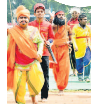
కరీంనగర్ గ్రౌండ్లో విద్యార్థుల ప్రదర్శనలు