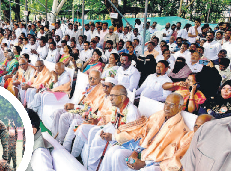
కరీంనగర్ పరేడ్ గ్రౌండ్ లో వేడుకలను తిలకిస్తున్న స్వాతంత్ర్య సమరయోధులు, నగరవాసులు