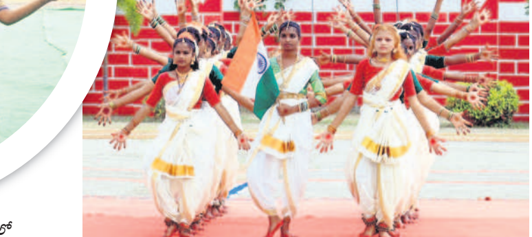
పెద్దపల్లిలో విద్యార్థుల సత్కరణ ప్రదర్శన