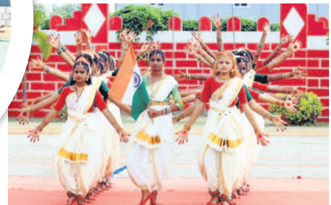
పెద్దపల్లిలో విద్యార్థుల సత్కరణ ప్రదర్శన