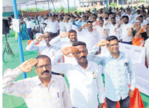
జగిత్యాలలో జెండాకు వందనం చేస్తున్న ప్రజలు