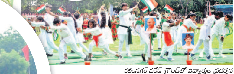
కరీంనగర్ పరేడ్ గ్రౌండ్ లో విద్యార్థుల ప్రదర్శన