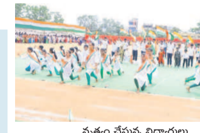
స్వత్యం చేస్తున్న విద్యార్థులు

వరకు 28,018 మంది రైతులకు రూ.132 కోట్లు, రెండో విడతలో రూ.1.50 లక్షల వరకు రుణం ఉన్న 18,377 మంది రైతులకు రూ.137 కోట్ల మాఫీ చేసినట్లు చెప్పారు. జిల్లాలో మొత్తం 44,495 మంది రైతులకు రూ.2.69 కోట్ల రుణాలను మాఫీ చేసే వారి ఖాతాల్లో సంబంధిత నగదును జమ చేశామని