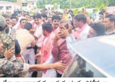
మాజీ ఎమ్మెల్యే రేగా కాంతారావును అడ్డుకుంటున్న పోలీసులు

కొత్తగూడెం అర్బన్, ఆగస్టు 15 : పినపాక, ఇల్లెంపూ మాజీ ఎమ్మెల్యే రేగా కాంతారావు, హరిప్రియ సహా బీఆర్ఎస్ ప్రజా ప్రతినిధులు, నాయకులను భద్రాద్రి జిల్లా పోలీసులు గురువారం అరెస్టు చేశారు. భద్రాద్రి జిల్లాలోని పినపాక నియోజకవర్గంలో తెలంగాణ తొలి ముఖ్యమంత్రి, ఉద్యమ సారథి కేసీఆర్ నిర్మించిన సీతారామ ప్రాజెక్టు నీళ్లను పినపాక, ఇల్లెంపూ నియోజకవర్గాలకు; భద్రాద్రి జిల్లాకు ఇవ్వకుండా ఖమ్మం జిల్లా మంత్రులు వారి నియోజకవర్గాలకు తరలించుకు వెళ్తుండడాన్ని నిరసిస్తూ రేగా కాంతారావు, హరిప్రియలు గురువారం అందోళనకు పిలుపునిచ్చిన విషయం విదితమే. భద్రాద్రి జిల్లా ములకలపల్లి మండలం పూసూరుగెండ్ల వద్ద సీతారామ ప్రాజెక్టు రెండో పంపుచౌసిన సీఎం రేవంకరెడ్డి గురువారం ప్రారంభించిన సీతారామ ప్రాజెక్టు నీళ్లను పినపాక, ఇల్లెంపూ లతో కలిసి వెళ్లి వీరు అడ్డుకుంటారేమోననే ఆలోచనతో భద్రాద్రి జిల్లా పోలీసులు గురువారం వీరిని ముందస్తు అరెస్టు చేశారు. బీఆర్ఎస్ భద్రాద్రి జిల్లా అధ్యక్షుడిగా ఉన్న రేగా కాంతారావు.. జిల్లా కేంద్రమైన కొత్తగూడెంలోని బీఆర్ఎస్ జిల్లా కార్యాలయంలో గురువారం ఉదయం వేళ స్వాతంత్ర్య దినోత్సవం జెండాను ఎగురవేశారు. అనంతరం పోలీస్ కార్యాలయం నుంచి బయటకు వస్తున్న రేగా కాంతారావు, హరి