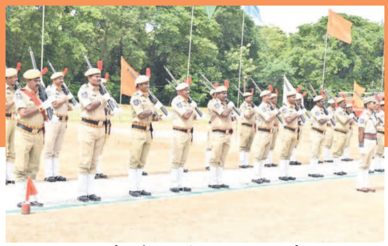
ఖమ్మం పోలీస్ పరేడ్ గ్రౌండ్ లో కచాన నిర్వహిస్తున్న పోలీసులు