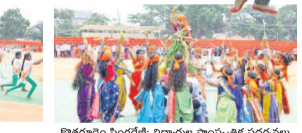
కొత్తగూడెం సింగరేణి: విద్యార్థుల సాంస్కృతిక ప్రదర్శనలు