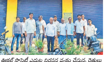
ఊకల్ సాస్ట్రో ఎదుట నిరసన వ్యక్తం చేస్తున్న రైతులు

గీసుగొండ, ఆగస్టు 13 : వరంగల్ జిల్లా గీసుగొండ మండలం ఊకల్ రైతు సహకార సంఘంలో రుణం తీసుకున్న రైతులకు అధికారుల తప్పిదంతో రుణాలు మాఫీ కాలేదు. ఈ మేరకు మంగళవారం సాస్ట్రో కార్యాలయ ఆవరణలో రైతులు నిరసన వ్యక్తం చేశారు. వివరాలిలా ఉన్నాయి. ఊకల్ సాస్ట్రో పరిధిలో 13 గ్రామాల చెందిన సుమారు 3 వేల మంది సభ్యత్వం కలిగి రుణాలు తీసుకున్నారు. ఇందులో అధికారుల నిర్లక్ష్యంతో 184 మందికి రుణమాఫీ వర్తించలేదు. రుణమాఫీ తమకు ఎందుకు రాలేదని రైతులు గీసుగొండ వ్యవసాయ శాఖ కార్యాలయానికి వెళ్లి వాకలు చేయగా ఆధార్ నంబర్ తప్పగా