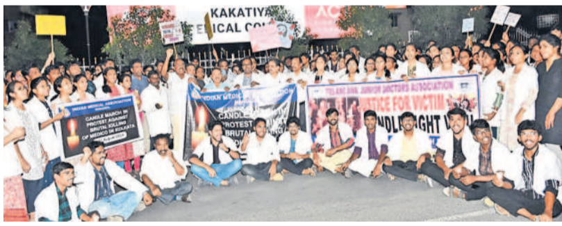
ఎంజీఎం సింబల్ లో నిరసన తెలుపుతున్న జూనియర్ డాక్టర్లు, వైద్యులు