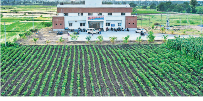
ప్రకృతి ఒడిలో పోలీస్ ఠాణా

చుట్టూ పచ్చని పంట పొలాల నడుమ అభివృద్ధి కర వాతావరణంలో ఉన్న ఈ పోలీస్ ఠాణా ప్రత్యేక ఆకర్షణగా నిలుస్తోంది. జయశంకర్ భూపాలపల్లి జిల్లా టేకుమట్లలో తెలంగాణ తొలి సీఎం కేసీఆర్ సర్కారు సకల హంగులతో ఈ పోలీస్ స్టేషన్ ను నిర్మించింది. ఆలయం వెళ్లే ప్రజలతో పాటు స్టేషన్ కి వచ్చే వారు ప్రకృతి ఒడిలో ఉన్న ఈ స్టేషన్ ను చూసి మురిసిపోతున్నారు. పక్కనే ఉన్న మైదానంలో యువకులు, పోలీస్ సిబ్బంది సాయంత్రం వేళ ఆటలు ఆడుతూ స్వచ్ఛమైన చచ్చని గాలిని ఆస్వాదిస్తూ సరికొత్త అనుభూతి పొందుతున్నారు.