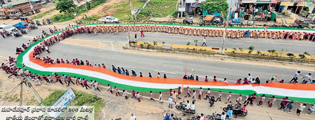
త్రివర్ణ శోభితం మహాదేవపూర్లో 500 మీటర్ల జాతీయ జెండాతో భారీ ర్యాలీ స్వాతంత్ర్య దినోత్సవ వేడుకలను పురస్కరించుకొని మంగళవారం మహాదేవపూర్ లో 500 మీటర్ల జాతీయ జెండాతో భారీ ర్యాలీ నిర్వహించారు. ప్రభుత్వ పాఠశాలలు, డి.గ్రీ, జూనియర్ కళాశాల విద్యార్థులతో కలిసి త్రివర్ణ పతాకాన్ని ప్రధాన రహదారుల మీదుగా ప్రదర్శించిన తీరు ఆకట్టుకుంది. -మహాదేవపూర్, ఆగస్టు 13