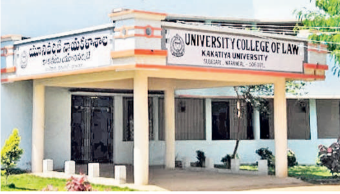
కాకతీయ యూనివర్సిటీ లా కాలేజీ