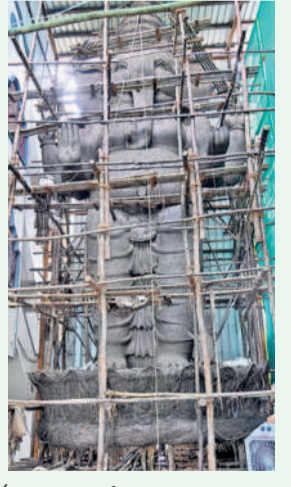
నిర్మాణంలో ఉన్న 40 అడుగుల మట్టి వినియోగదేతర విగ్రహం