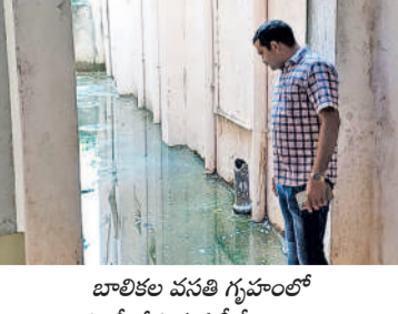
బాలికల వసతి గృహంలో తనిఖీ చేస్తున్న ఏసీబీ అధికారి