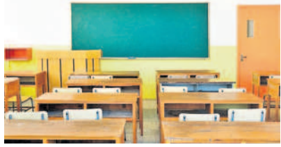
మీడియా నివేదికలు చెబుతున్నాయి.

రీ(సీసీ) ద్వారా దాదాపు 50 వేలకు పైగా పాఠశాలలో ఉపాధ్యాయుల అధికారం టీచర్ల వద్ద ఉంది. విద్యార్థుల కార్యకలాపాలపై రియల్ టైమ్ పర్యవేక్షణ చేస్తున్నామని ప్రభుత్వం చెబుతున్నప్పటికీ, అయితే తాజాగా వెలుగులోకి వచ్చిన అంశం ఏం సమాచారం చెబుతున్నది.