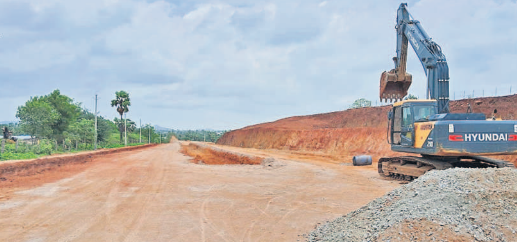
నాగన్పల్లిలోని సర్వే నంబర్ 189లో గల ప్రభుత్వ భూమిలో నుంచి అక్రమంగా వెంచర్లలోకి వేసిన రోడ్డు