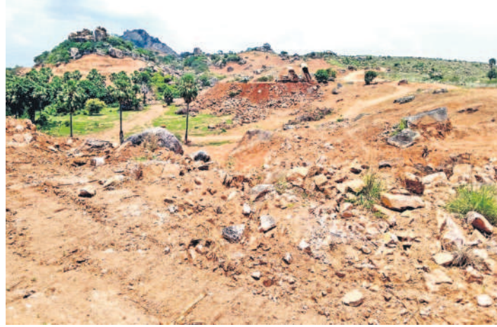
ఇందిరాసాగర్ చెరువు పద్ద ముమ్మరంగా సాగుతున్న పనులు పక్కన ఇందిరా సాగర్ చెరువు మ్యూజి