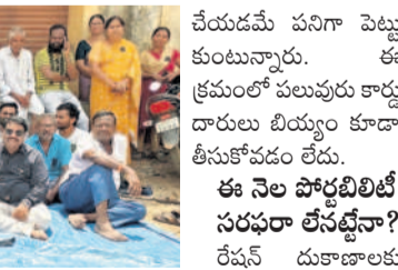
చేరాల్లిన జనరల్ కోటా మంగళవారం నాటికి