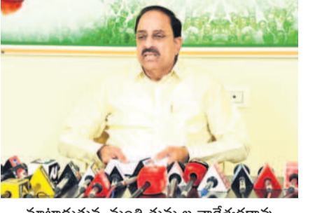
మాట్లాడుతున్న మంత్రి తుమ్మల నాగేశ్వరరావు

'సీతారామ్' పూర్తికి రూ. 10 వేల కోట్లు కావాలి.. ఆస్ట్రేలియా కోసం బీఆర్ఎస్ చేసింది చెప్పడానికి అభ్యంతరం లేదు ఈ నెల 15న సీతారామ్ ప్రాజెక్టు ద్వారా సాగునీరు విడుదల విలేకరుల సమావేశంలో మంత్రి తుమ్మల నాగేశ్వరరావు ఖమ్మం, ఆగస్టు 13 (నమస్తే తెలంగాణ ప్రతినది) : సీతారామ్ ప్రాజెక్టును సంపూర్ణంగా పూర్తి చేసేందుకు మరో రూ.10 వేల కోట్లు, ఇద్దో సమయం కావాలని రాష్ట్ర ప్రభుత్వం సాయ శాఖ మంత్రి తుమ్మల నాగేశ్వరరావు స్పష్టం చేశారు. ఖమ్మంలోని తన క్యాంపు కార్యాలయంలో ఆయన మంగళవారం వినోద సమావేశంలో మాట్లాడారు. గత కేసీఆర్ ప్రభుత్వం వెచ్చించిన రూ.8 వేల కోట్లతో పూర్తయిన పనులతో లింకే కెనాల్ ద్వారా రైతులకు సాగునీరు అందించేందుకు ఈ నెల 15న సీఎం రేవంత్ రెడ్డి ద్వారా ప్రారంభోత్సవం చేపట్టినట్లు తెలిపారు. ఇప్పటికే పంపుహౌస్లు, పైపులైన్ల నిర్మాణం పూర్తి కాగా.. రైతాంగం ఆలోచనలతో ఏకీకృతంగా నీటి విడుదల లకు చర్యలు తీసుకున్నామని చెప్పారు. గత కేసీఆర్ ప్రభుత్వ హయాంలోనే సీతారామ్ ప్రాజెక్టుకు టీజిఎం డిఎం డన్నారు. సీతారామ్ ప్రాజెక్టుపై మాజీ మంత్రి, బీఆర్ఎస్ నేత హరీశ్ రావు చేసిన వ్యాఖ్యాన తనను బాధించాయని అన్నారు. అయితే, బీఆర్ఎస్ చేసిన పనిని తాము చెప్పుకుంటున్నట్లు జరుగుతున్న ప్రచారంలో ఎంతమాత్రమూ నిజం లేదని వ్యాఖ్యానించారు. సంకుచిత పనులను సీఎస్సీ కాదు.. సత్తుపల్లి ప్రాంతానికి క్షణమే సాగునీరు అందించేందుకు అవకాశం కలిగించుకునే ఉపయోగించాం తప్ప తనకు ఒక ప్రాంతం పట్ల ప్రేమ, మరో నియోజకవర్గం పట్ల