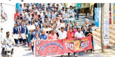
నిరసన ప్రదర్శన చేస్తున్న పీడీఎస్యూ నాయకులు, కార్యకర్తలు