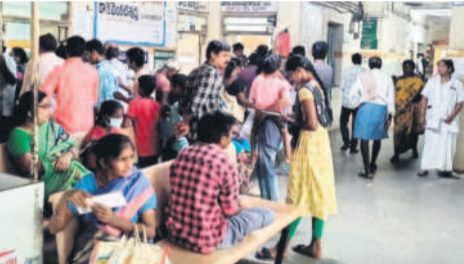
రోగులతో కిటికీలూడుతున్న సత్తుపల్లి ప్రభుత్వ ఆసుపత్రి

సత్తుపల్లిలో తీవ్రంగా వైద్యుల కొరత.. సత్తుపల్లి టౌన్, ఆగస్టు 13 : సత్తుపల్లి ఆసుపత్రికి వచ్చే రోగుల్లో సింహభాగం జ్వర పీడీతులే ఉంటున్నారు. ఇంతకు ముందు వరకూ 300 వరకూ ఉండే ఔట్ పేషెంట్ల సంఖ్య ఇప్పుడు జ్వరాల సీజన్ కారణంగా 400కు చేరింది. 30 బెడ్ల సామర్థ్యం ఉన్న ఈ ఆసుపత్రిలో వాటికి సరిపడా రోగులు ఇన్ పేషెంట్లుగా నమోదవుతున్నారు. కానీ ఇక్కడ వైద్యుల సమస్య ప్రధానంగా వేధిస్తోంది. 59 మంది వైద్యులు ఉండగా 10 మంది మాత్రమే విద్యలో ఉన్నారు. సర్కారు వైద్య రంగానికి పెద్దపీట వేసిన గత కేసీఆర్ ప్రభుత్వం గతంలోనే కోట్లాది రూపాయలతో సత్తుపల్లిలో వంద బెడ్ల ఆసుపత్రిని నిర్మించింది. కానీ ఎవనిది నిలబడ క్రితం అధికారంలోకి వచ్చిన కాంగ్రెస్ ప్రభుత్వం దానిని ఇంకా ప్రారంభించలేదు. దీనికోసం వైద్యుల కొరత కూడా ఉండడంతో రోగుల తాకిడికి అనుగుణంగా వైద్య సేవలు అందడం లేదు.