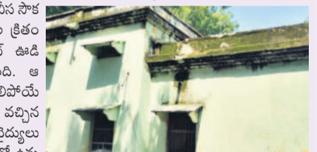
శిథిలావస్థలో బూర్గంపహాడే ఆసుపత్రి భవనం

'సీతారామ్' పూర్తికి రూ. 10 వేల కోట్లు కావాలి.. ఆస్ట్రేలియా కోసం బీఆర్ఎస్ చేసింది చెప్పడానికి అభ్యంతరం లేదు ఈ నెల 15న సీతారామ్ ప్రాజెక్టు ద్వారా సాగునీరు విడుదల విలేకరుల సమావేశంలో మంత్రి తుమ్మల నాగేశ్వరరావు ఖమ్మం, ఆగస్టు 13 (నమస్తే తెలంగాణ ప్రతినది) : సీతారామ్ ప్రాజెక్టును సంపూర్ణంగా పూర్తి చేసేందుకు మరో రూ.10 వేల కోట్లు, ఇద్దో సమయం కావాలని రాష్ట్ర ప్రభుత్వం సాయ శాఖ మంత్రి తుమ్మల నాగేశ్వరరావు స్పష్టం చేశారు. ఖమ్మంలోని తన క్యాంపు కార్యాలయంలో ఆయన మంగళవారం వినోద సమావేశంలో మాట్లాడారు. గత కేసీఆర్ ప్రభుత్వం వెచ్చించిన రూ.8 వేల కోట్లతో పూర్తయిన పనులతో లింకే కెనాల్ ద్వారా రైతులకు సాగునీరు అందించేందుకు ఈ నెల 15న సీఎం రేవంత్ రెడ్డి ద్వారా ప్రారంభోత్సవం చేపట్టినట్లు తెలిపారు. ఇప్పటికే పంపుహౌస్లు, పైపులైన్ల నిర్మాణం పూర్తి కాగా.. రైతాంగం ఆలోచనలతో ఏకీకృతంగా నీటి విడుదల లకు చర్యలు తీసుకున్నామని చెప్పారు. గత కేసీఆర్ ప్రభుత్వ హయాంలోనే సీతారామ్ ప్రాజెక్టుకు టీజిఎం డిఎం డన్నారు. సీతారామ్ ప్రాజెక్టుపై మాజీ మంత్రి, బీఆర్ఎస్ నేత హరీశ్ రావు చేసిన వ్యాఖ్యాన తనను బాధించాయని అన్నారు. అయితే, బీఆర్ఎస్ చేసిన పనిని తాము చెప్పుకుంటున్నట్లు జరుగుతున్న ప్రచారంలో ఎంతమాత్రమూ నిజం లేదని వ్యాఖ్యానించారు. సంకుచిత పనులను సీఎస్సీ కాదు.. సత్తుపల్లి ప్రాంతానికి క్షణమే సాగునీరు అందించేందుకు అవకాశం కలిగించుకునే ఉపయోగించాం తప్ప తనకు ఒక ప్రాంతం పట్ల ప్రేమ, మరో నియోజకవర్గం పట్ల