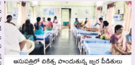
ఆసుపత్రిలో చికిత్స పొందుతున్న జ్వర పీడీతులు

నిలవల మండలాల రోగులూ బూర్గంపహాడే.. నిలవల, ఆగస్టు 13 : సీజనల్ వ్యాధులతోపాటు జ్వరాలూ విజృంభించిన వేళ బూర్గంపహాడే ఆసుపత్రికి రోగుల తాకిడి పెరుగుతోంది. ఈ మండలాలలోని రోగులకూ పొరుగున్న ములలపల్లి, ఏపిల్ వీలి ఆసుపత్రిలో చికిత్స పొందుతున్న జ్వర పీడీతులు నమోదవుతున్నాయి. వేలేరుపాడు మండలాల రోగులూ కూడా వైద్య సేవ కోసం ఈ ఆసుపత్రికి వస్తున్నారు. 30 బెడ్ల ఉన్నప్పటికీ రోగులకు సంఖ్యకు అవి సరిపోవడం లేదు. కేవలం ఔట్ పేషెంట్ల రోజుకు సుమారు 200 మంది వరకూ వస్తున్నారంటే రోగులు, జ్వర పీడీతుల తాకిడి ఏ స్థాయిలో ఉందో అర్థం చేసుకోవచ్చు. రోగుల సంఖ్య అధికంగా ఉండే ఈ ఆసుపత్రి భవనం శిథిలావస్థలో ఉంది. నూతన ఆసుపత్రి నిర్మాణానికి గత కేసీఆర్ ప్రభుత్వం రూ.2.70 కోట్ల మంజూరు చేసినప్పటికీ కొత్తగా వచ్చిన కాంగ్రెస్ ప్రభుత్వం దానిపై దృష్టి పెట్టడం లేదు. ఇక ఈ ఆసుపత్రిలో పారిశుధ్యం అధ్వానంగా ఉంది. మరుగుదొడ్లు, మంచినీళ్ల పంటి కనీస సౌకర్యాలు లేవు. 20 రోజుల క్రితం పోస్టుమార్గం గది స్టాటే ఊడి వైద్యుడిపై తలపై పడింది. ఆ శవాల గది కూడా కూలిపోయి దళలో ఉంది. ఇక్కడికి వచ్చిన మృతదేహాలను స్థాయికి వైద్యులు ఏడు కిలోమీటర్ల దూరంలో ఉన్న భద్రాచలం ఏరియా ఆసుపత్రికి పంపిస్తున్నారు.