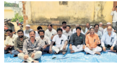
ఖమ్మం అర్బన్ ఎంఎల్ఎస్ పాయింట్ వద్ద ధర్నా చేస్తున్న రేషన్ డిలర్లు