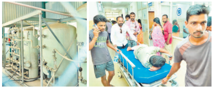
నిరుపయోగంగా ఉన్న ఆక్సిజన్ ప్లాంట్, రోగిని స్ట్రెచర్పై తీసుకెళ్తున్న బంధువులు