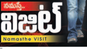
నమస్తే. Namaste VISIT

వనపర్తి, ఆగస్టు 13 (నమస్తే తెలంగాణ) : వనపర్తి జిల్లా దవాఖానలో వైద్యులు, సిబ్బంది కొరత వేధిస్తున్నది. వైద్య, ఆరోగ్య శాఖలో ఉన్న ఖాళీలను భర్తీ చేయకపోవడంతో రోగులకు సరైన వైద్యసేవలందడం లేదు. మొత్తం 218 పోస్టులకుగానూ 65 మంది మాత్రమే విధులు నిర్వహిస్తున్నారు. 153 పోస్టులు ఖాళీగా ఉన్నాయి. ఇదిలా ఉండగా, సీజనల్ వ్యాధులు ప్రబలుతున్నాయి. పక్కం రోజులూ ఏ దవాఖానలో చూసినా జ్వర వ్యాధిగ్రస్తులతో నిండిపోతున్నాయి. వనపర్తి జిల్లా దవాఖానకు నీ కర్తవ్యం 500 నుంచి 800 మంది వరకు రోగులు వస్తున్నారు. 450 పడకలతో ఉన్న ఈ దవాఖానకు రోగుల తాకిడి పెరిగింది. సాధారణ జ్వరాలతోపాటు మలేరియా, డెంగీ, చికున్ గున్యా వంటి కేసులు వస్తున్నాయి. జిల్లాలోని పది గ్రామాలలో డెంగీ వ్యాధి లక్షణాలున్న వారిని గతంలో వైద్య శాఖ గుర్తించింది. అయితే, జూలై నుంచి డెంగీ కేసులను మాత్రమే గుర్తించగా.. మిగిలిన కేసులు అంతకుముందున్న నెలల్లో సమాదర్యంగా.. అలాగే, వాన కాలం సీజనకు ముందే మదనాపురం మండలం దంకనూరు గ్రామంలో చికున్ గున్యా కేసు నమోదైంది. అక్కడ ప్రత్యేక శిబిరం ఏర్పాటు చేసి వ్యాధి నివారణ చర్యలు చేపట్టారు. వ్యాధులను గుర్తించిన గ్రామాలలో డోసుల నివారణ, మందుల పినికారీ వంటి ముందస్తు చర్యలు తీసుకున్నారు. అయితే, అనధికారికంగా డెంగీ, చికున్ గున్యా కేసులు అధికంగా నమోదవుతున్నట్లు సమాచారం. సర్కార్ దవాఖానల్లో ఈ రోగుల అలికిడి కనిపించక పోగా.. రోగులంతా ప్రైవేట్ దవాఖానలకు క్యూ కడుతున్నారు.