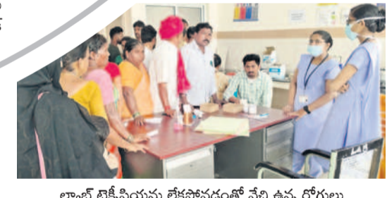
ల్యాబ్ టెక్నిషియన్లు లేకపోవడంతో వేచి ఉన్న రోగులు