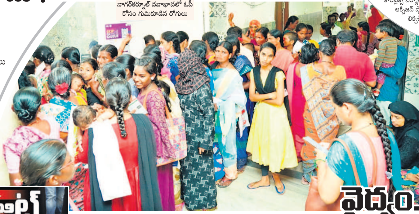
నాగర్ కర్నూల్ దవాఖానలో ఓపి కోసం గుమికూడిన రోగులు

గద్వాల, ఆగస్టు 13 : వైద్యం సమయపాలన పాటించకపోవడంతో ప్రభుత్వ దవాఖాన వచ్చే రోగులు అవస్థలు పడుతున్నారు. ఉదయం 10 గంటల దాటిగా కొందరు డాక్టర్లు విధులు హాజరు కాకపోవడంతో రోగులకు సరైన వైద్యం సమయానికి అందడం లేదు. జిల్లా కేంద్రంలో ఉన్న వైద్యులైన పరిపత్ దవాఖాన ప్రస్తుతం జిల్లా దవాఖానకు రూపొందించిన చిందింది. అందుకు అవసరమైన సౌకర్యాలు కేసీఆర్ సర్కారు కల్పించింది. కానీ, కాంగ్రెస్ ప్రభుత్వం అధికారంలోకి వచ్చిన తర్వాత ఉన్న సౌకర్యాలును వినియోగించుకోలేని పరిస్థితి నెలకొన్నది. రిజిస్ట్రేషన్ రోజు 600 నుంచి 700 వరకు ఓపి ఉంటుంది. 100 నుంచి 150 డాక్ ఇన్ పేషెంట్లు ఉంటున్నారు. అయితే ప్రస్తుతం జిల్లా దవాఖానకు ఏర్పాటు కావడంతోపాటు త్వరలో మెడికల్ కళాశాల ప్రారంభం అవుతుండడంతో మెడికల్ కళాశాల కోసం అవసరమైన సిబ్బందిని 42 మందిని ప్రభుత్వం నియమించింది. వీరితోపాటు ప్రస్తుత దవాఖానలో 30 మంది నర్సింగ్ స్టాఫ్ ఉండగా మెడికల్ కళాశాల కోసం మరో 56 మందిని తీసుకున్నారు. అయితే తీసుకున్న వైద్య సిబ్బందిలో గగ భాగం వైద్యులు సరైన సమయానికి విధులు