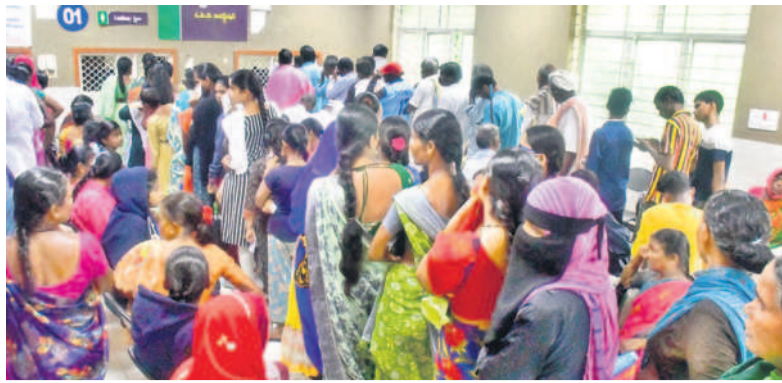
వనపర్తి జిల్లా దవాఖానలో వివిధ బిజీత్వల కోసం టోకెన్ల తీసుకుంటున్న జనం