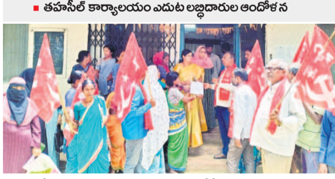
తహసీల్దార్ కార్యాలయం ఎదుట లబ్ధిదారుల ఆందోళన

చందూర్, ఆగస్టు 12 : చందూర్ జుండల కేంద్రంలోని మునిసిపల్ కాలనీలో భూములను కేటాయిస్తూ 17 ఏండ్ల క్రితం పట్టాలు అందజేసి, ఇప్పటికీ స్థలాలను చూపించలేదని చందూర్ గ్రామానికి చెందిన లబ్ధిదారులు ఆగ్రహం వ్యక్తం చేశారు. తమకు స్థలాలు చూపించాలని డిమాండ్ చేస్తూ సీపీఎం నాయకులతో కలిసి చందూర్ తహసీల్ కార్యాలయం ఎదుట లబ్ధిదారులు ఎర్రబాందీలు పెట్టి పట్టాలను పొందాలని డిమాండ్ చేశారు. అనంతరం రాష్ట్ర తహసీల్ కార్యాలయానికి వెళ్లి డిమాండ్ చేశారు. అనంతరం రాష్ట్ర తహసీల్ కార్యాలయానికి వెళ్లి డిమాండ్ చేశారు. అనంతరం రాష్ట్ర తహసీల్ కార్యాలయానికి వెళ్లి డిమాండ్ చేశారు.