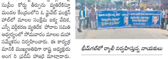
బీజేపీలో రాల్చి నిర్వహిస్తున్న నాయకులు