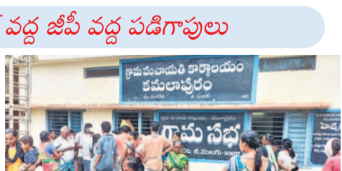
మరోసారి దరఖాస్తులు చేసుకునేందుకు వచ్చిన బాధితులు