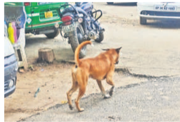
ఎంజీఎం ఆవరణలో సంచరిస్తున్న వీధికుక్క