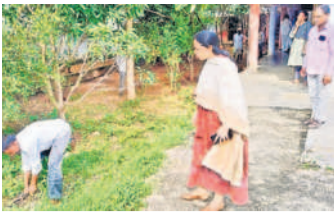
తహసీల్దార్ కార్యాలయంలో వీధి మొక్కలు తొలగిస్తున్న వాహనదారుడు