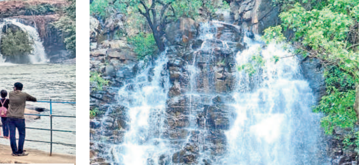
జలపాతం పూర్తి భాగంలో పోటోలు దిగుతూ పర్యాటకుల సందడి

బొగత హాయిలు.. చిట్టి ముత్యాల చిందులు ములుగు జిల్లా వాజేడు మండలం చీకపల్లి లుట్టి ప్రాంతంలోని బొగత జలపాతం హాయిలు పోతున్నది. ఇదే మండలం బొల్లారం, మహితాపురం గ్రామాల మధ్యలోని లుట్టి ప్రాంతంలో ఉన్న చిట్టి ముత్యాల జలపాతం చిందులు తొక్కుతోంది. బీటి అందాలను చూసిన పర్యాటకులు ఫిదా అవుతున్నారు. ఆదివారం సెలవు దినం కావడంతో రాష్ట్రంలోని నలు మూలల నుంచి పెద్ద ఎత్తున తరలి వచ్చి సందడి చేశారు. ఫోటోలు, సెల్ఫీలు దిగుతూ, న్నానాలు చేస్తూ ఎంజాయ్ చేశారు. - వాజేడు, ఆగస్టు 11