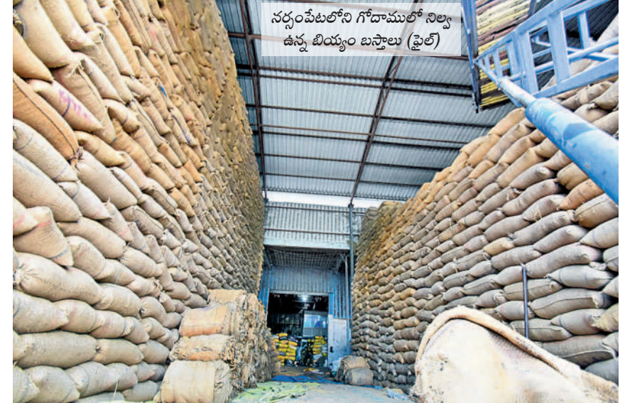
నర్సంపేటలోని గోదాములో నిల్వ ఉన్న బియ్యం బియ్యం (ఫైల్)