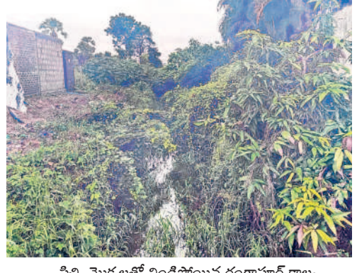
పిచ్చి మొక్కలతో నిండిపోయిన రంగాపూర్ కాల్వ

గోవిందరావుపేట, ఆగస్టు 11 : వేలాడే ఎకరాలకు సాగునీరందించే ములుగు జిల్లాలోని లక్కవరం సరస్సు కింద ఉన్న నాలుగు ప్రధాన కాల్వలు పిచ్చిమొక్కలు, చెత్తాదెబ్బలతో నిండిపోయాయి. దీంతో తమకు నీరందేదెలా అని చివరి ఆయకట్టు రైతులు ఆందోళన చెందుతున్నారు. శ్రీరాంపతి కోట, రంగాపూర్, నర్సింహాల కాల్వల ద్వారా ప్రస్తుత నీజ నీలో పంట పొలాలకు నీరందక రైతులు ఇబ్బంది పడుతున్నారు. ఈ నాలుగు కాల్వల ద్వారా అధికారికంగా 8,500, అనధికారికంగా మరో 4 వేల ఎకరాల్లో పంట సాగువుతుంది. అయితే కాల్వల్లో పిచ్చిమొక్కలు పెరగడంతో పాటు అక్కడక్కడా గండ్లు పడ్డాయి. కాల్వల పరిస్థితిని పరిశీలించేందుకు అధికారులు అటువైపు రావడం లేదు. దీంతో పంట చివరి దశలో తమకు నీరందకుండా లేదోననే భయాందోళనలో రైతులున్నారు. ఇప్పటికై నా ప్రభుత్వం స్పందించి కాల్వల్లో పిచ్చిమొక్కలను తొలగించడంతో పాటు గండ్లను పూడ్చివేయాలని ఆయకట్టు రైతులు కోరుతున్నారు.