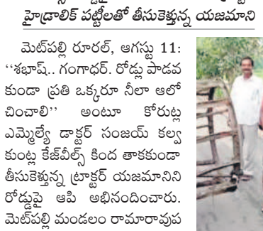
కేజీవీల్ రోడ్డుపై తగలకుండా మరో ట్రాక్టర్ హైడ్రాలిక్ పట్టెలతో తీసుకెళ్లిన యజమాని