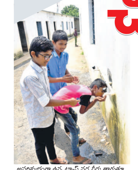
అపరిశుభ్రంగా ఉన్న ట్యాంక్ వద్ద నీరు తాగుతూ..