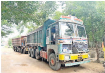
పోలీస్ స్టేషన్ కు తరలించిన ఇసుక బిచ్చుర్లు

టీఆర్ఎస్ సర్కారు మెట్ట రైతులకు నిరందించాలనే సలకల్పంతో కాళ్ళెక్కరం ప్యాకేజీ-9లో భాగంగా మల్కపేట రిజర్వాయర్ నిర్మాణం చేపట్టింది. ఇందులో భాగంగా లిఫ్ట్ల ద్వారా మండలానికి ప్రధాన జలవనరు అయిన నిమ్మపల్లి మూల వాగు ప్రాజెక్టును నివేదిక రూ.168 కోట్లు మంజూరు చేసింది. మెగా కంపెనీ పనులు దక్షిణ చుకొని ప్రారంభించింది. పనుల నిర్వహణకు నిమ్మపల్లి శివారులో కంపెనీ బాండ్లు ఫ్లాంట్ ను ఏర్పాటు చేసుకున్నారు. పైపులు, ఇతర సామగ్రిని ఇందులో నిల్వ ఉంచారు. అప్పటి ప్రభుత్వం ఉచిత ఇసుక రవాణాకు ఉత్తర్యులు ఇవ్వడంతో లిఫ్ట్ పనులకు అవసరమైన ఇసుకను ఇక్కడే నిల్వ చేశారు. కొంతమేర పనులు కూడా పూర్తి చేశారు. అయితే ప్రభుత్వం మారడం.. నిధులు రాకపోవడంతో పనులు ఆర్థాతరంగా నిలిచిపోయాయి.