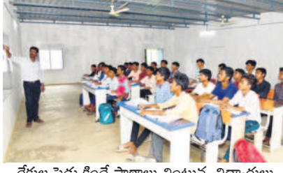
రేకుల పెద్ద కిందనే పాఠాలు చెబుతున్న విద్యార్థులు