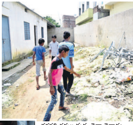
తరగతి గదుల మధ్య చెత్తా చెదారం