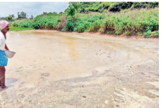
మాందాపేటలో వరి విత్తనాలు వెదజల్లుతున్న రైతు

సాగులో వ్యయం తగ్గించుకునే దిశగా రైతులు అడుగులు వేస్తున్నారు. ఈ కోవలోనే వరి పంటలో వెద జల్లే పద్ధతి విస్తరిస్తున్నది. కూరీలు దొరకని పరిస్థితుల్లో వారి అవసరం లేకుండానే సాగు చేస్తున్నారు. పెట్టుబడి తగ్గడంతోపాటు ముందుగానే కోతకు వస్తుండడంతో అన్నదాతలు వెదజల్లే సాగు వైఖరి మొగ్గుచూపుతున్నారు. ఇప్పటికే శాయంపేట మండలంలో సుమారు వెయ్యి ఎకరాలకుపైగానే ఈ విధానంలో సాగుయ్యింది.