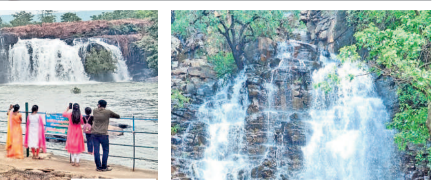
జలపాతం వ్యాఖ్యానంలో పాటోలు దిగుతూ వర్కాటకుల సందడి