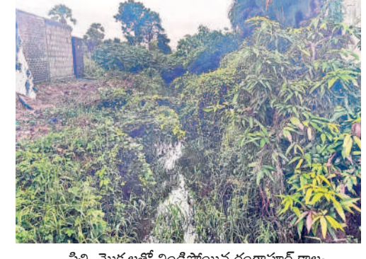
పిచ్చి మొక్కలతో నిండిపోయిన రంగపూర్ కాల్య

గోవిందరావుపేట, ఆగస్టు 11 : వేలాడే ఎకరాలకు సాగునీరందించే ములుగు జిల్లాలోని లక్ష్మవరం సరస్సు కింద ఉన్న నాలుగు ప్రధాన కాల్యలు పిచ్చిమొక్కలు, చెత్తావెదారంతో నిండిపోయాయి. దీంతో తమకు నీరందేదెలా అని చివరి ఆయకట్టు రైతులు అందోకన చెందుతున్నారు. శ్రీరాంపతి కోట, రంగపూర్, నర్సింహాల కాల్యలు ద్వారా ప్రస్తుత నీజ నీలో పంట పొలాలకు నీరందక రైతులు ఇబ్బంది పడుతున్నారు. ఈ నాలుగు కాల్యల ద్వారా అధికారికంగా 8,500, అనధికారికంగా మరో 4 వేల ఎకరాల్లో పంట సాగువుతుంది. అయితే కాల్యల్లో పిచ్చిమొక్కలు పెరగడంతో పాటు అక్కడక్కడా గండ్లు పడ్డాయి. కాల్యాల పరిస్థితిని పరిశీలించేందుకు అధికారులు అటువైపు రావడం లేదు. దీంతో పంట చివరి దశలో తమకు నీరందకుండా లేదోననే భయాందోళనలో రైతులున్నారు. ఇప్పటికైతే ప్రభుత్వం స్పందించి కాల్యల్లో పిచ్చిమొక్కలను తొలగించడంతో పాటు గండ్లను పూడ్చివేయాలని ఆయకట్టు రైతులు కోరుతున్నారు.