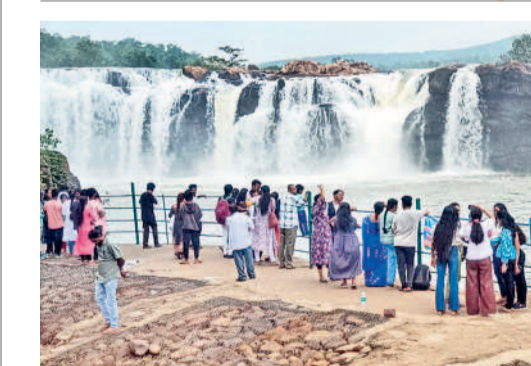
జలపాతం వ్యాఖ్యానంలో పాటోలు దిగుతూ వర్కాటకుల సందడి