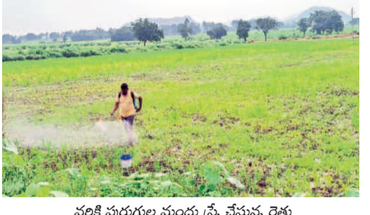
వరి పంటకు మందు ద్రవ్యం వేస్తున్న రైతు

నాలు వేసే పద్ధతిలో ఒక బస్తా (30) కిలోల విత్తనాలకు సుమారు రూ. 1200 అవుతుండగా, ఆదీ వెదజల్లే పద్ధతిలో కేవలం 12 కిలోలు అంటే రూ. 400 వరకు ఖర్చవుతోంది. ఎకరాకు నాలు వేసేందుకు సుమారు 12 మంది కూరీలు అవసరం కాగా, ఒక్కొక్కరికి రూ. 300 చొప్పున రూ. 3600 వ్యయం అవుతోంది. నారు పోసేందుకు ఖర్చవుతున్నది. ఈ ఇబ్బందులేమీ లేకుండా వెదజల్లే పద్ధతిలో రైతులకు మొలకలు కొచ్చిన విత్తనాలను పొలంలో కొన్ని గంటల్లోనే పచ్చలుతున్నారు. దుక్కి దుక్కి, గొర్రు కొట్టి నాలు వేసేందుకు నీళ్లు ఉంచుతారు. వెదజల్లే పద్ధతిలో మాత్రం బురదగా ఉంటేనే విత్తనాలు జల్లుతున్నాయి. దీంతో నీళ్లు వాడకం కూడా తక్కువగానే ఉంటున్నదని రైతులు చెబుతున్నారు. శారీరక శ్రమ కూడా తక్కువగా ఉండడంతో అన్యదాతలు వరిలో వెదజల్లే సాగుకు ముగ్గువ చూపుతున్నారు. మధ్యలో బాటలు తీస్తూ సమానంగా విత్తనాలు వెదజల్లుతుండడంతో పిలకలు ఆరోగ్యంగా ఉంటాయని, చీడపీడల నుంచి రక్షణ లభించి దిగుబడి మెరుగయ్యేందుకు ఆస్కారం ఉంటుందని చెబుతున్నారు. ఈ క్రమంలో వెదజల్లే సాగుపై వ్యవసాయ శాఖ పెద్ద ఎత్తున అవగాహన కల్పించాల్సిన అవసరమంది రైతులు కోరుతున్నారు.