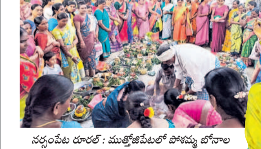
నర్సంపేట దూరలో : ముత్తేజిపేటలో పోచమ్మ బోనాల వేడుకల్లో పాల్గొన్న గ్రామస్థులు

పాచమ్మ, ముత్యాలమ్మ, మైసమ్మ, పెద్దమ్మలకు సమర్పణ ఆకట్టుకున్న శివనత్తుల పూసకాలు, పోతరాజుల విన్యాసాలు శ్రావణ మాస బోనాలతో సందడిగా పల్లెలు