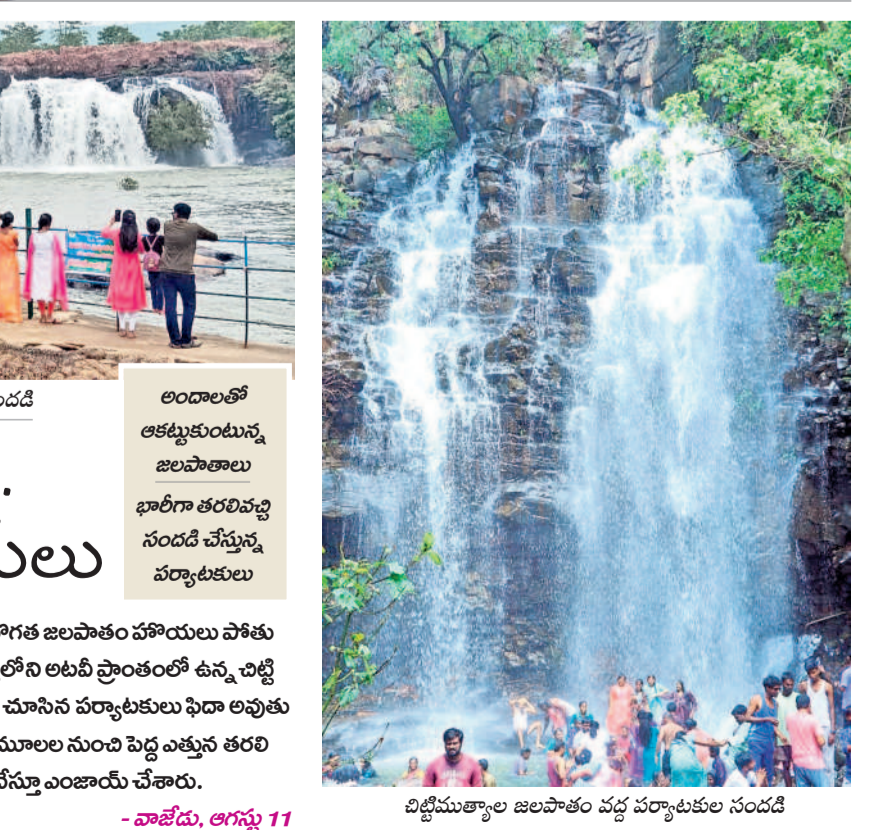
జలపాతం పూర్తి భాగంలో ఫోటోలు దిగుతూ పర్యాటకుల సందడి