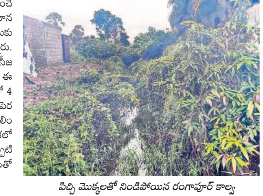
పిచ్చి మొక్కలతో నిండిపోయిన రంగాపూర్ కాల్వ