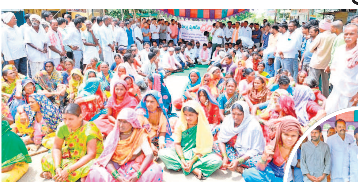
రోడ్డుపై వైరాయింది నిరసన తెలుపుతున్న రైతులు

మద్దూర్ (దుద్దూర్), ఆగస్టు 11 : వ్యవసాయమే జీవనాధారంగా చేసుకున్న రైతుల గుండెల్లో ఫార్మా కిచ్చు రోడ్డుపై వైరాయింది నిరసన తెలుపుతున్న రైతులు. రోడ్డుపై వైరాయింది నిరసన తెలుపుతున్న రైతులు. రోడ్డుపై వైరాయింది నిరసన తెలుపుతున్న రైతులు. రోడ్డుపై వైరాయింది నిరసన తెలుపుతున్న రైతులు.