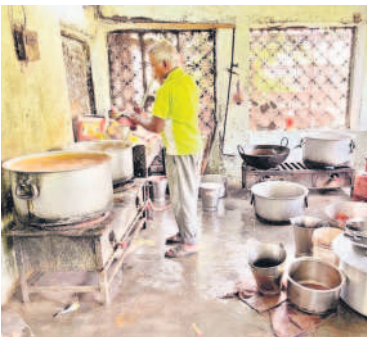
ఇరుగు గదిలో వంట చేస్తున్న నివాసిని

గోడలను తాకితే పాకే కొడుతుందని మరికొందరు భయాందోళనలు వ్యక్తం చేస్తున్నారు. చాలీచాలని ఇరుగుగదుల్లో కాలం వెల్లడిస్తున్నారు. దీంతో సమస్యలకు కేరాఫ్ మారింది. భోజనంలో పురుగులు వస్తున్నాయని విద్యార్థులు, వారి తల్లిదండ్రులు చెబుతున్నారు. ప్రభుత్వం సరఫరా చేస్తున్న బియ్యం నాసిరకంగా ఉండడమే ఇందుకు కారణం.. పురుగులు ఉన్న బియ్యాన్ని తిరిగి పంపిస్తున్నామని, అప్పై సరఫరా చేస్తున్న బియ్యంలోనూ పురుగులు యథావిధిగా ఉంటున్నాయని స్కూల్ డీవర్లు చెబుతున్నారు. ఇక్కడ నెలకొన్న సమస్యలపై పాలకులు, అధికారులు స్పందించి సమస్యలను పరిష్కరించాలని విద్యార్థులు, అధికారులు కోరుతున్నారు.