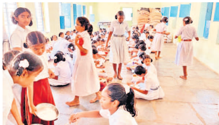
బాలానగర్ గురుకుల పాఠశాలలో నేలపై కూర్చోని భోజనం చేస్తున్న విద్యార్థిని