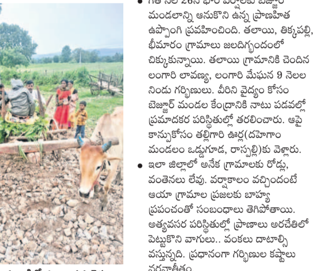
వాగు ఒడ్డు నుంచి ఎడ్ల బండిలో దవాఖానకు వెళ్తున్న