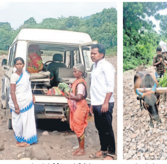
వాగు ఒడ్డున ప్రసవించిన శిశువు