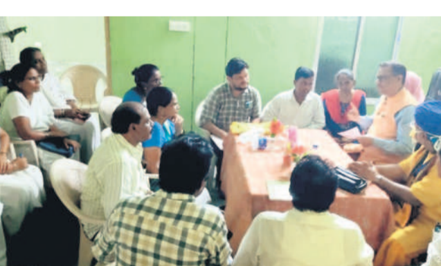
కొటాల సీహెచ్ఎస్లో సిబ్బందితో మాట్లాడుతున్న హెల్త్ డైరెక్టర్ రవీంద్ర నాయక్