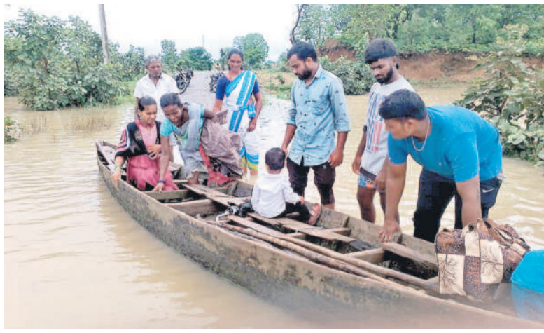
నాటవడపల్లి వాగు దాటుతున్న గర్భిణులు లంగరి లావాణ్యం లంగరి మేఘన (ఫైల్)