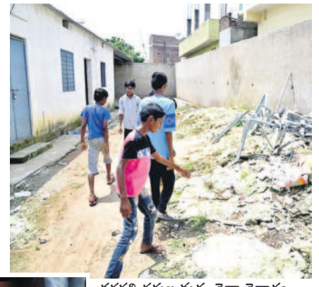
తరగతి గదుల మధ్య చెత్తా చెదారం