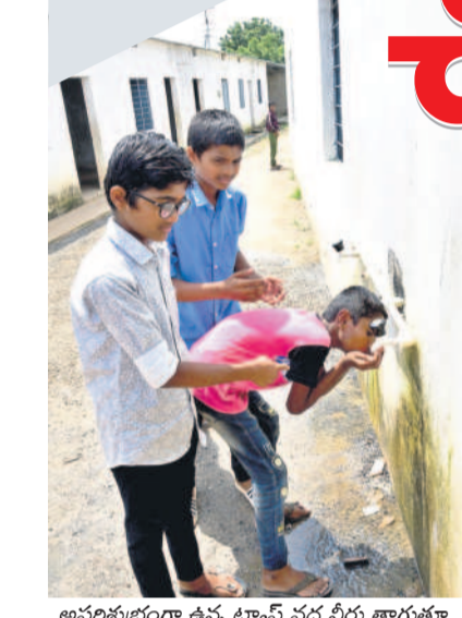
అపరిశుభ్రంగా ఉన్న ట్యాంక్ వద్ద నీరు తాగుతూ..