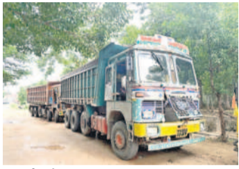
పోలీస్ స్టేషన్ వద్ద తరలింపిన ఇసుక బిచ్చుర్లు