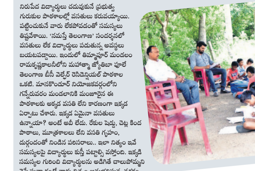
తిమ్మాపూర్ మండలం రామకృష్ణకాలనీలోని మహాత్మా జ్యోతిబా పూలే బీసీ వెల్ఫేర్ రెసిడెన్షియల్ పాఠశాలలో చెట్ల కిందనే పాఠశాల చెబుతున్న ఉపాధ్యాయులు

నరక ప్రాయంగా గురుకులాలు అద్దె భవనాల్లో విద్యార్థుల అవస్థలు డ్రైనేజీ క్లియర్ లేక నిత్యం దుర్గంధం రేకుల పెద్ద.. చెట్ల కింద తరగతులు ఎండకు ఉడికి పోతున్న విద్యార్థులు ఐదు నెలలుగా రాని మేన్ బిల్లులు నాణ్యత తగ్గిన భోజనంతోనే సరి