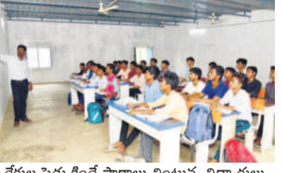
రేకుల పెద్ద కిందనే పాఠశాల వింటున్న విద్యార్థులు