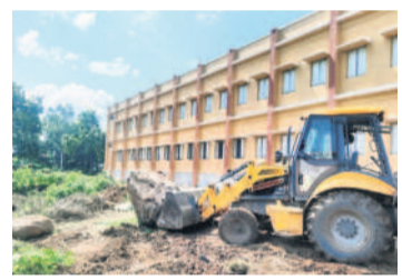
కొత్త భవనం వెనకాల పాడుబడిన బావిని పూడ్చుతున్న ఎక్స్ కవేటర్

మెటేపల్లి రూల్, ఆగస్టు 10: పునమైన చరిత్ర కలిగిన పెద్దాపూర్ బాలుర గురుకులంలో ఇద్దరి ప్రాణాలు పోతే గానీ అధికారులు తేరుకోలేదు. వరుస పుటనలు జరిగితే గానీ రక్షణ చర్యలు చేపట్టాలన్న విషయం గుర్తుకొచ్చింది. గత నెల 28న ఓ విద్యార్థి పుట్టి చెందగా, ఆస్వస్థతకు గురైన మరో ఇద్దరు విద్యార్థులు చికిత్స తర్వాత కోలుకున్నారు. ఈ నెల 9న మరో విద్యార్థి మృతి చెందగా, మరో ఇద్దరు తీవ్ర ఆస్వస్థతతో నిజామాబాద్ లో చికిత్స పొందుతున్నారు. మొదటి పుటన తర్వాత ప్రీన్స్ పాల్ ను సన్నాండ్ చేసి, పాత భవనంలోని విద్యార్థులకు ఆసంపూర్ణంగా ఉన్న కొత్త భవనంలో తాత్కాలిక వసతి కల్పించి అధికారులు చేతులు దులుపుతున్నారు. తిరిగి రెండో పుటనలో మరో విద్యార్థి ప్రాణాలు కోల్పోవడంతో తల్లిదండ్రుల ఆగ్రహానికి గురైన ప్రజాప్రతినిధులు, అధికారులు ఇప్పుడు తేరుకోని కొత్త భవనాన్ని పూర్తిస్థాయిలో అందుబాటులోకి తెచ్చేందుకు పూనుకున్నారు. కోరుట్ల మున్సిపాలిటీలోపాటు వెల్లుల్ల, వోల మద్ది, పెద్దాపూర్ గ్రామపంచాయతీ పొలిట్ సభ్యుల సీట్లందీ గురుకులం పాఠశాల ఆవరణ చదును చేయించారు. ఎక్స్ పేరిట్లు, ట్రాక్టర్ల సహాయంతో పనులు చేపట్టారు. సాధించినంత తొందరగా పనులు పూర్తిచేసేందుకు దాదాపు ఏడు రోజులు పడుతుందని ఆయన చెప్పారు. సాధ్యమైనంత తొందరగా పనులు పూర్తిచేసి ఈ నెల 15న విద్యార్థులు తల్లిదండ్రులతో సమావేశం ఏర్పాటు చేస్తామని, 18 నుంచి కొత్త భవనంలో తరగతులు నిర్వహిస్తామని తెలిపారు.