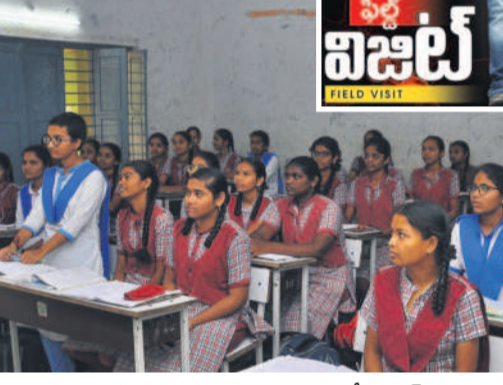
తాటిపెల్లి గురుకులం తరగతి గదిలో ట్యూట్ వెలుతురులో విద్యార్థులు

బోధన లంకలలో ఇబ్బందులు గురుకులం పాఠశాలలో బోధనకు సంబంధించిన కొన్ని సమస్యలు పిల్లలను ఇబ్బందిపెడుతున్నాయి. గురుకులాన్ని జూనియర్ కాలేజీగా అప్ గ్రేడ్ చేసినా, కాలేజీ పిల్లల కోసం ప్రత్యేక వసతిగృహాలు, డార్టెటరీ హాల్, బోజనశాల, తరగతి గదులు, ప్రయోగశాలలు ఏపీ నిర్మించలేదు. దీంతో పాఠశాలకు సంబంధించిన తరగతి గదులు, ప్రయోగశాలలు, బోజనశాలలోనే అద్దెలు కాలాల్సిన వ్యవస్థ. జూనియర్ కాలేజీ తరగతి గదులు ఇప్పటికీ రావడంతో పాఠశాల విద్యార్థుల తరగతి గదులు పూర్ణంగా శిథిలమైన వాటిలో నిర్వహించాల్సిన దుస్థితి ఉన్నది. బెంబిల, కర్నూలు సైతం చెడిపోయిన వాటిని పిల్లలు వినయంగా వాటిని వస్తున్నది. పై కప్పులు దెబ్బతిని, కిటికీలు, తలుపులు విరిగిపోయి, ప్రమాదకరంగా ఉన్న తరగతి గదుల్లో చదువు కోవడం కనిపించింది. ఇంటర్ పిల్లలకు ప్రత్యేకమైన ల్యాబ్ లను ఏర్పాటు చేయలేదు. చదో తరగతి పిల్లలకు సంబంధించిన ల్యాబ్ లోనే ఇంటర్ పిల్లలు ప్రయోగాలు చేసుకోవాలని దుస్థితి నెలకొంది. ఇక బోధన సిబ్బంది నియామకం విషయంలోనూ ప్రభుత్వం పట్టించుకోవడం కనిపిస్తున్నది. జూనియర్ కాలేజీని ఏర్పాటు చేసినప్పటికీ, లెక్చరర్లను అపాయింట్ మెంట్ చేయలేదు. కేవలం ఐదుగురు ఫ్యాకల్టీ మెంబర్లను మాత్రం తాత్కాలిక వ్యవధిలో నియామించారు. ఇక జూనియర్ కాలేజీని ఏర్పాటు చేసినప్పటికీ, లెక్చరర్లను అపాయింట్ మెంట్ చేయలేదు. కేవలం ఐదుగురు ఫ్యాకల్టీ మెంబర్లను మాత్రం తాత్కాలిక వ్యవధిలో నియామించారు. ఇక జూనియర్ కాలేజీని ఏర్పాటు చేసినప్పటికీ, లెక్చరర్లను అపాయింట్ మెంట్ చేయలేదు. కేవలం ఐదుగురు ఫ్యాకల్టీ మెంబర్లను మాత్రం తాత్కాలిక వ్యవధిలో నియామించారు.