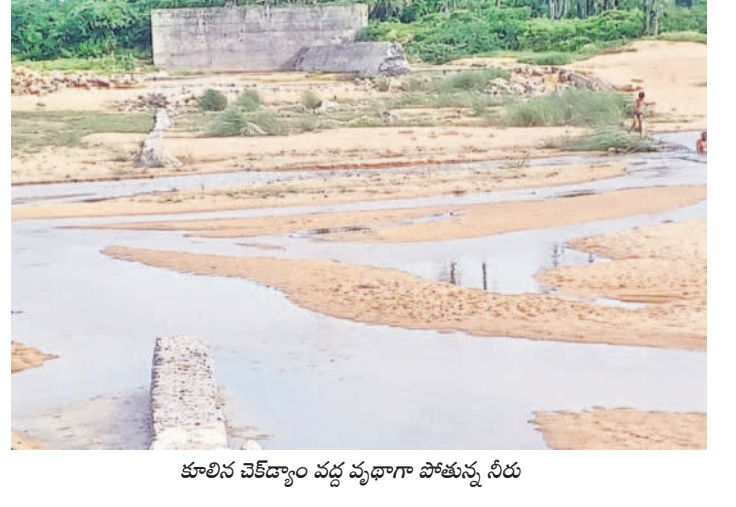
కూలిన చెక్కడం వద్ద పురాగా పోతున్న నీరు

రాజన్న సిరిసిల్లా, ఆగస్టు 10 (నమస్తే తెలంగాణ) : పురాగా పోతున్న వరదనీటిని ఒడిసి పట్టుకొన్న నీరు గారిపోతున్నది. రాజన్న సిరిసిల్లా జిల్లాలోని మానేరు, మూలనాగులను జీవనదులుగా మార్చాలన్న ఉద్దేశ్యంతో కేసీఆర్ ప్రభుత్వం ₹174 కోట్లతో 24 చెక్కడాల నిర్మాణానికి శ్రీతారం చుట్టడి. అందులో సిరిసిల్లా మానేరుపై గంభీరావుపేట మండలం నర్సాల నుంచి మొదలుకని సిరిసిల్లా మానేరు బ్రిడ్జి వరకు 11, వేములవాడ మూలనాగుపై కోసరావుపేట మండలం నిమ్మాపల్లి నుంచి మొదలు వేములవాడ బ్రిడ్జి వరకు 18 నిర్మించేందుకు ప్రణాళికలు రూపొందించడంతో పాటు మొత్తంగా 20 పూర్తి చేసింది. మరో నాలుగు నిర్మాణంలో ఉన్నాయి. పూర్తి చేసిన చెక్కడాలలో నీళ్లు నిలువడంలో రెండు వైపులా భూగర్భ జలాలు పెరిగాయి. దీంతో రైతులకు పుష్కలంగా సాగునీరు అందడంతోపాటు ఇతర అవసరాలకు ఉపయోగపడాయి. అయితే, గతేడాది కురిసిన భారీ వర్షాలు, భారీ వరదల కారణంగా సిరిసిల్లా మానేరు వాగుపైన సాయినగర్లో ఒకటి, వేములవాడ మూలనాగుపైన రెండు చెక్కడాలు కొట్టుకుపోయాయి. ఆ తర్వాత ఎన్నికలు రాగా, కాంగ్రెస్ ప్రభుత్వం ఏర్పడింది. అధికారంలోకి వచ్చి ఎనిమిది నెలవుతున్నా చెక్కడాలను పట్టించుకోలేదు. ఫలితంగా వర్షపు నీరంతా పురాగా పోతున్నది. ఎండకాలంలో మరమ్మతులు చేయస్తే ఈ నీరంతా నీటిని ప్రయోజనం దక్కేది. ఇప్పటికైనా మరమ్మతులు చేయిస్తే రైతులకు మేలు జరుగుతుంది.