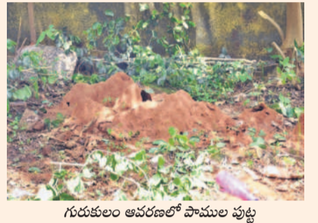
గురుకులం ఆవరణలో పాముల పుట్ట