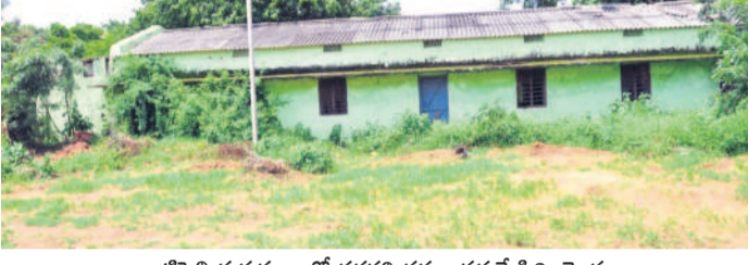
తాటిపెల్లి గురుకులంలో తరగతి గదిల పక్కనే పిల్లి మొక్కలు

గురుకులాలు సమస్యల వలయంలో కోట్లా మిట్టాడుతున్నాయి. అసలే శిథిలావస్థకు చేరిన భవనాలు, అటవీ ప్రాంతాన్ని తలపిస్తున్న పరిస్థితి, అరకొర వసతుల మధ్యని నిర్వహణ లేక అధ్యాపకంకా మారాయి. ఆవరణలో చెట్లపొదలు, పాముల పుట్టలు మిల్లలను పటిష్టిస్తున్నాయి. స్నానపుగదులు, మూత్రశాలలు, మరుగుదొడ్డు సరిపడా కరువయ్యాయి. పడుకునేందుకు బెడ్డు కూడా లేక నేలపైనే నిద్రించాల్సిన పరిస్థితులు ఉన్నాయి. చాలాచోట్ల రాత్రిపూట కరెంటు పోతే బీకట్లు కమ్ముకుంటున్నాయి. మెట్లపల్లి మండలం పెద్దాపూర్ గురుకులంలో 15 రోజుల వ్యవధిలోనే ఇద్దరు విద్యార్థులు చనిపోయారు, మరో నలుగురు తీవ్ర ఆస్వస్థత చెందడానికి నిర్వహణ లోపం, వసతుల లేమే కారణమని తెలుస్తున్నట్లుగా, శనివారం 'నమస్తే తెలంగాణ' పలు గురుకులాలను విజిట్ చేసింది. ఎటు చూసినా సమస్యలే కనిపించగా, పిల్లలు భయభయంగా గడుపుతున్నట్లు వెలుగులోకి వచ్చింది.