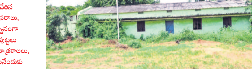
తాటిపెల్లి గురుకులంలో తరగతి గదుల పక్కనే పిచ్చి మొక్కలు

జగిత్యాల, ఆగస్టు 10 (సమస్తి తెలంగాణ): మల్కాపుల మండలం తాటిపెల్లి బాలికల గురుకుల పాఠశాల ఉమ్మడి కరీంనగర్ జిల్లాలోనే ఉత్తమ విద్యా కేంద్రంగా పేరుగాంచింది. ఇది 1988 నవంబర్ 20న ప్రారంభమై, నాలుగు దశాబ్దాలుగా విద్యాబోధన సాగిస్తూనే ఉన్నది. మొదట 5 నుంచి పడో తరగతి వరకు ఉండగా, 2019-20 విద్యా సంవత్సరం నుంచి డిసెయిబిల్డ్ జూనియర్ కాలేజీగా అప్ గ్రేడ్ అయింది. ప్రస్తుతం స్కూల్లో 650 మంది ఆధ్వర్యిస్తున్నారు. ఐదు నుంచి పడో తరగతి దాకా రెండేసి సెక్షన్లు నిర్వహిస్తున్నారు. ఎంపీసీ, బైపీసీ విభాగంలో జూనియర్ కాలేజీ నడుస్తుండగా, ప్రస్తుతం ఫస్ట్ యియర్లో 88 మంది, సెకండ్ యియర్లో 86 మంది చదువుతున్నారు. సెకండ్ యియర్ చదువుతున్న వారందరూ ఫస్ట్ యియర్ 400కు పైగా మార్కులు సాధించినవారే కావడం విశేషం. పడో తరగతి వరకు సైతం విద్యార్థులకు నాణ్యమైన విద్యనే అందుతున్నది.