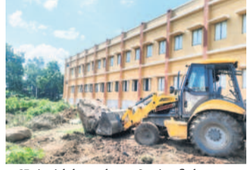
కొత్త భవనం వెనకాల పాడుబడిన బావిని పూడ్చుతున్న ఎక్స్ కవేటర్