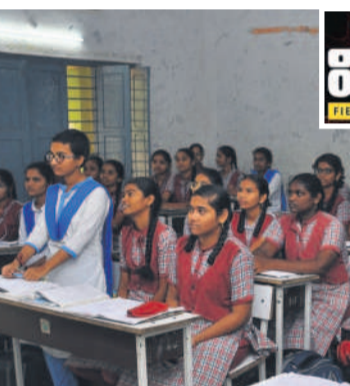
తాటిపెల్లి గురుకులం తరగతి గదిలో ట్యూబ్ వెలుతురులో విద్యార్థినులు

గురుకులాల సమస్యల వలయంలో కొట్టుమిట్టాడుతున్నాయి. అసలే శిథిలావస్థకు చేరిన భవనాలు, అటవీ ప్రాంతాన్ని తలపిస్తున్న పటనరాలు, అరకొర వనతుల మధ్యన నిర్వహణ లేక అధ్వానంగా మారాయి. ఆవరణలో చెట్లపొదలు, పాముల పుట్టులు పిల్లలను పణికిస్తున్నాయి. స్నానపుగదులు, మూత్రశాలలు, మరుగుదొడ్లు సరిపడా కరువయ్యాయి. పడుకునేందుకు బెడ్లు కూడా లేక నేలపైనే నిద్రించాల్సిన పరిస్థితులు ఉన్నాయి. చాలాచోట్ల రాత్రిపూట కరెంటు పోతే బీకట్లు కమ్ముకుంటున్నాయి. మెట్లపల్లి మండలం పెద్దాపూర్ గురుకులంలో 15 రోజుల వ్యవధిలోనే ఇద్దరు విద్యార్థులు చనిపోయారు, మరో నలుగురు తీవ్ర అన్యస్థలకు చెందడానికి నిర్వహణ లోపం, వనతుల లేమే కారణమని తెలుస్తుండగా, శనివారం 'సమస్తి తెలంగాణ' పలు గురుకులాలను విజిట్ చేసింది. ఎటు చూసినా సమస్యలే కనిపించగా, పిల్లలు భయభయంగా గడుపుతున్నట్లు వెలుగులోకి వచ్చింది.