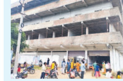
రక్షణ లేని గంగాధర మహాత్మా జ్యోతిబాపూలే బాలికల గురుకుల పాఠశాల భవనం

గంగాధర, ఆగస్టు 10 : గంగాధర మండలం మదురాపగర్ల చౌరస్తాలోని మహాత్మా జ్యోతిబాపూలే బాలికల గురుకుల పాఠశాలలో సమస్యలు తీవ్రమయ్యాయి. 600 మంది విద్యార్థులు ఉన్న ఈ పాఠశాలను పట్టించుకునేవారు కరువయ్యారు. పాఠశాలలో 14 బాత్రూములు ఉన్నాయని, ఉదయం 8 గంటలకు నిద్ర లేచి స్నానం చేస్తే కాసుకు అందుతామని, ఏ కాలంలోనైనా చచ్చి క్షతో స్నానం చేస్తున్నామని విద్యార్థులు వాపోయారు. స్నానం చేయడానికి నీళ్లు సరిపోవడం లేదని, రెండు బోల్డర్ల ఒక్కటే వాడుతున్నారని, మరో దాని దగ్గర నీళ్లు పట్టుకుంటే తిడుతున్నారని ఆరోపించారు. భోజనంలో పురుగులు వస్తున్నాయని, శనివారం కూడా వచ్చాయని తమ తల్లిదండ్రులతో వాపోయారు. పాఠశాల ఎదుట మొదటి అంతస్తులకు ఏర్పాటు చేయలేదని, గదులకు ఉన్న కిటికీలు సరిగా లేక తమకు రక్షణ లేకుండా పోతోందన్నారు. రాత్రి సమయంలో బాత్రూముల వెళ్లడం వల్ల ఇబ్బందులు పడుతున్నారని, గతంలో అక్కడికి పాము వచ్చిందని చెబుతున్నారు. సోమవారం అడివనల్ కల్తెర్ల పాఠశాలకు వచ్చినప్పుడు సమస్యలు వివరించినా ఫలితం లేదని వాపోయారు. పై అధికారులు స్పందించి పాఠశాలలో ఉన్న సమస్యలను పరిష్కరించాలని కోరుతున్నారు. ఇక్కడి సమస్యలతో ఆరోపనో అజరిగి పోనీలో సంప్రదించగా, వివరణ చేసే చర్యలు తీసుకుంటామని తెలిపారు.