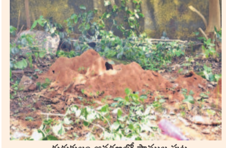
గురుకులం ఆవరణలో పాముల పుట్టు