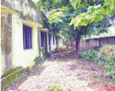
గురుకులం ఆవరణలో పిచ్చి మొక్కలు

వసతిగృహాల్లో అసౌకర్యాలు రాజ్యమేలుతున్నాయి. 174 మంది ఇంటర్ విద్యార్థులకు కేవలం 10 స్నానపు గదులే ఉన్నాయి. బాత్రూముల్ తమకు పెద్ద సమస్యగా మారాయని పిల్లలు ఆవేదన వ్యక్తం చేశారు. ఉదయం 5 నుంచి 6 మధ్య వ్యాయామం, తేడలు ఉంటాయని, 6 నుంచి 7 గంటల మధ్య స్నానానికి సమయం కేటాయించారన్నారు. గంట వ్యవధిలో పది స్నానపుగదుల్లో 174 మంది ఎలా స్నానం చేస్తారని వాపోయారు. కాలక్రమణాలు, స్నానానికి ఒక్కొక్కరికి కనీసం 10 నుంచి 15 నిమిషాలు పడుతుందని, ఈ లెక్కన గంటలో ఒక్క వాడే రూమ్ ను ఇడుగురి కంటే 60 ముందే వాడే రూమ్, ఎంత వేగంగా పనులు చేసుకున్నా 60 నుంచి 70 మంది కంటే ఎక్కువ మందిలేరన్నారు. 7 నుంచి 8 గంటల మధ్య