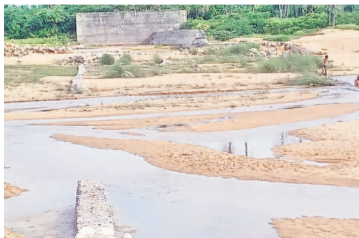
కూలిన చెక్ డ్యాం వద్ద పుణ్యా పోతున్న నీరు

రాజన్న సిరిసిల్ల, ఆగస్టు 10 (సమస్తి తెలంగాణ) : పుణ్యా పోతున్న వరదనీటిని ఒడిసి పట్టాలన్న లక్ష్యం నీరు గారిపోతున్నది. రాజన్న సిరిసిల్ల జిల్లాలోని మానేరు, మూలవాగులను జీవనదులుగా మార్చాలన్న ఉద్దేశ్యంతో కేసీఆర్ ప్రభుత్వం ₹174 కోట్లతో 24 చెక్ డ్యాంల నిర్మాణానికి తీవ్రంగా చుట్టినది. అందులో సిరిసిల్ల మానేరుపై గంధీరావుపేట మండలం నర్సాల నుంచి మొదలుకుని సిరిసిల్ల మానేరు ట్రిప్లీ వరకు 11, వేములవాడ మూలవాగుపై కోసరావుపేట మండలం నిమ్మపల్లి నుంచి మొదలు వేములవాడ ట్రిప్లీ వరకు 18 నిర్మించేందుకు ప్రణాళికలు రూపొందించడంతో పాటు మొత్తంగా 20 పూర్తి చేసింది. మరో నాలుగు నిర్మాణంలో ఉన్నాయి. పూర్తి చేసిన చెక్ డ్యాంలలో నీళ్లు నిలువడంలో రెండు వైపులా భూగర్భ జలాలు పెరిగాయి. దీంతో రైతులకు పుష్కలంగా సాగునీరు అందడంతోపాటు ఇతర అవసరాలకు ఉపయోగపడ్డాయి. అయితే, గవేటి కురిసిన భారీ వర్షాలు, భారీ వరదల కారణంగా సిరిసిల్ల మానేరు వాగుపైన సాయిగర్లో ఒకటి, వేములవాడ మూలవాగుపైన రెండు చెక్ డ్యాంలు కొట్టుకు పోయాయి. ఆ తర్వాత ఎన్నికలు రాగా, కాంగ్రెస్ ప్రభుత్వం ఏర్పడింది. అధికారంలోకి వచ్చి ఎనిమిది నెలలవుతున్నా చెక్ డ్యాంలను పట్టించుకోలేదు. ఫలితంగా వర్షపు నీరంతా పుణ్యా పోతున్నది. ఎండకాలంలో మరమ్మత్తులు చేయిస్తే ఈ నీరంతా నీలిచి ప్రయోజనం దక్కేది. ఇప్పుడైనా మరమ్మత్తులు చేయిస్తే రైతులకు మేలు జరుగుతుంది.