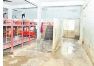
మన్యంకొండ గురుకులంలో మంచాల వైపు వస్తున్న బాత్రూం సీట్లు