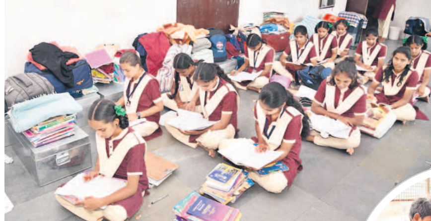
గిరిజన పాఠశాలలో ఒకే గదిలో సామగ్రి మధ్య విద్యార్థిభ్యాసం చేస్తున్న విద్యార్థినులు

విద్యార్థులకు రోగాలుస్తున్నా.. పట్టించుకోని వైనం