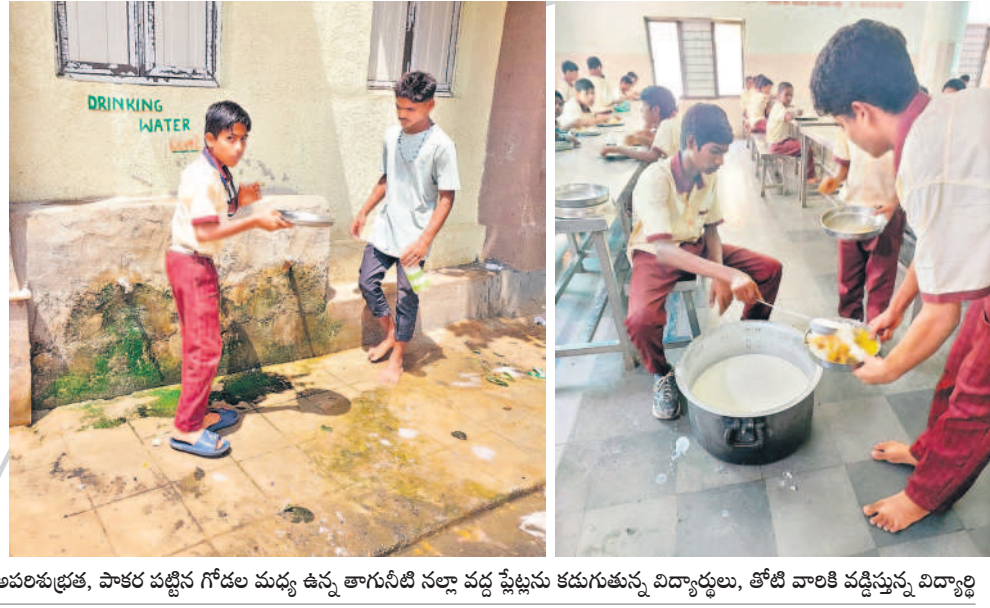
ఆవలకు ప్రకాశ, పాత చట్టిన గోడల మధ్య ఉన్న తాగునీటి నల్లా వద్ద షేడ్లను కడుగుతున్న విద్యార్థులు, తోటి వారికి వడ్డిస్తున్న విద్యార్థి

గద్వాల, ఆగస్టు 10 : గద్వాల నియోజకవర్గంలోని గురుకులాల సమస్యలకు నిలయాలూ మారాయి. బోధనా సిబ్బంది లేకపోవడంతో కనీస మౌలిక వసతులు కల్పించడంలో సర్కారు విఫలమైంది. గద్వాల మండలంలోని వీరాపురం సమీపంలోని బాలికల ఎస్టీ గురుకులాలలో 540 మంది విద్యార్థినులు ఉన్నారు.