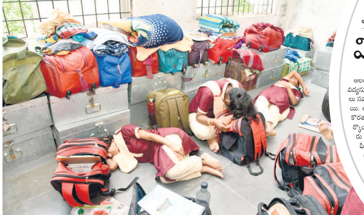
అలంపూర్/ఇటికాల, ఆగస్టు 10 : మెరుగైన విద్యను అందించేందుకు ప్రవేశపెట్టిన గురుకులాల సమస్యల వలయంలో కొట్టుమిట్టాడుతున్నాయి. అనంతరం కొందరు విద్యార్థులు అనేక ఇబ్బందులు ఎదుర్కొంటున్నారు.

గురుకుల విద్యాలయాల్లో గతంలో ఉదయం 9 గంటలకు తరగతులు ప్రారంభమవుతుండగా.. ఉదయం 5 గంటలకు లేచిన విద్యార్థులు 6 గంటల వరకు కాల్పుల తర్వాత తీరుకోని 8 గంటల వరకు రెడి అయి.. అల్పాహారం చేసి 9 గంటలకు వెళ్లేవారు.