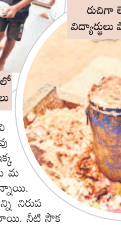
రుచిగా లేకపోవడంతో విద్యార్థులు పాఠశాలలో అన్నం

ర్యం పూర్తిస్థాయిలో లేకపోవడంతో కంప్యూటరులు అంతరించుకునేందుకు విముక్తం చేస్తున్నారు. ఇది ఈ ఒక్క గురుకులం పరిస్థితి మాత్రమే కాదు.. ఉమ్మడి జిల్లావ్యాప్తంగా ఎస్సీ, ఎస్టీ, బీసీ, మైనార్టీ గురుకులాలలో 50 శాతానికిపైగా ఇదే పరిస్థితులు ఉన్నాయి.