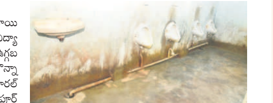
మన్యంకొండ టీసీ గురుకులంలో బాత్రూం దుస్థితి

టాయిలెట్లు అరకొర ప్రతి నెలా లక్షల్లో అద్దిలు చెల్లిస్తున్నా.. సరిపడా టాయిలెట్లు, మరుగుదొడ్లు లేకపోవడంతో బాలబాలికలు, విద్యార్థి, విద్యార్థులు విధిలేని పరిస్థితుల్లో ఉగ్రబుట్టకవాల్సిన పరిస్థితులు నెలకొన్నాయి. మహబూబ్ నగర్ రూరల్ మండలంలోని దర్శాపూర్ సమీపంలో ఉన్న టీసీ గురుకుల విద్యాలయంలో మొత్తం 680 మంది విద్యార్థులు చదువుతున్నారని తెలుసుకున్నాం.