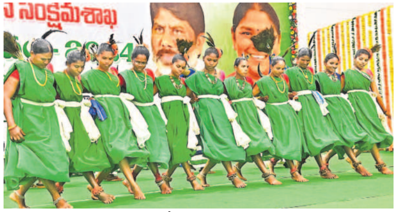
ప్రపంచ అదివాసీ దినోత్సవాన్ని పురస్కరించుకొని కుటుంబ థీం అదివాసీ భవన్లో జరిగిన వేడుకల్లో కళాకారుల నృత్యప్రదర్శన