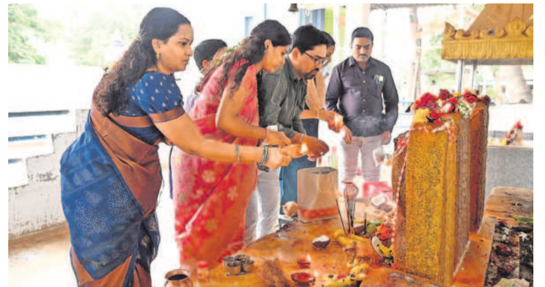
శుక్రవారం నాగుల వంచమ సంధర్మంగా నాగేంద్రుడి ప్రత్యేక పూజలు చేస్తున్న భక్తులు