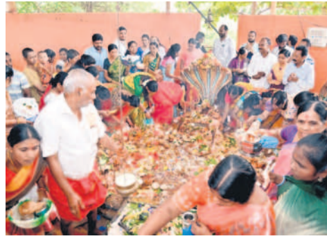
మంచెల దినోత్సవం : హమాలిదాద్లో పుట్టు వద్ద పూజలు చేస్తున్న మహిళలు

నమస్తే నెట్ వర్క్ : మంచిర్యాల, ఆసిఫా బాద్ జిల్లాల్లో శుక్రవారం నాగుల పంచమి వేడుకలను భక్తి శ్రద్ధలతో సుమంగా నిర్వహించారు. మహిళలు ఉదయమే ఆలయాలకు చేరుకొని నాగదేవతకు పూజలు చేశారు. పుట్టల్లో పాలు పోసి పట్టు వస్త్రాలతో నైవేద్యాలను సమర్పించారు. ఆగోత్రాల వెలిగించి, కొబ్బరి కాయలు కొట్టి మొక్కులు తీర్చుకున్నారు. సమృద్ధిగా వర్షాలు కురిసి పంటలు బాగా పండాలని, కుటుంబ సభ్యులంతా సుఖసంతోషాలతో ఉండాలని వేడుకున్నారు.