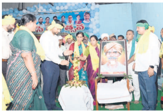
కుటుంబం చిత్తపటం వద్ద జ్యోతి ప్రజ్వలన చేస్తున్న కలెక్టర్ వెంకటేశ్ ధోతే, ఎమ్మెల్యే కోవ లక్ష్మి