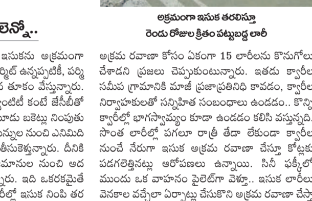
అక్రమంగా ఇసుక తరలిస్తూ రెండు రోజుల క్రితం పట్టుబడ్డ లారీ

దండాలలో ఉన్నవారంతా అధికార పార్టీవాళ్లే ఎన్నికలకు ముందు బీఆర్ఎస్ ఎమ్మెల్యే అక్రమ ఇసుక దండా చేస్తున్నారంటూ ఇప్పుడున్న ఎమ్మెల్యే వివేక్ ఆరోపించారు. ఆ లెక్కన ఇప్పుడు జరుగుతున్న ఇసుక అక్రమ దండా వెనుక నైజాం ఎమ్మెల్యే కన్నారా అనే అసమానాలు వ్యక్తం అవుతున్నాయి. ఈ దండాలలో మొత్తం అధికార పార్టీ నాయకులే ఉండడం ఈ వాదనకు బలం చేకూరుస్తున్నది. కోటపల్లి మండలంలో రాష్ట్రవ్యాప్తంగా డిమాండ్ ఉన్న ఓ ఇసుక క్యాలీలో ఇప్పుడున్న మూడు క్యాలీలకు సమీప గ్రామంలో ఉండే మాజీ సర్పంచ్ (కాంగ్రెస్ పార్టీ లీడర్) పెద్ద పట్టు ఇసుక అక్రమ రవాణా చేస్తున్నారు. ఇసుక