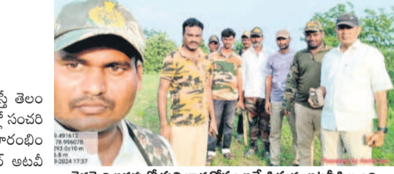
కెరమెల అటవీ ప్రాంతం వైపు వెళ్లినట్లు అనుమానిస్తున్న అటవీ సిబ్బంది

కుటుంబం చిత్తపటం వద్ద జ్యోతి ప్రజ్వలన చేస్తున్న కలెక్టర్ వెంకటేశ్ ధోతే, ఎమ్మెల్యే కోవ లక్ష్మి