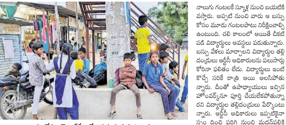
బస్సు కోసం బొంబాస్ పేటలో ఎదురు చూస్తున్న విద్యార్థులు