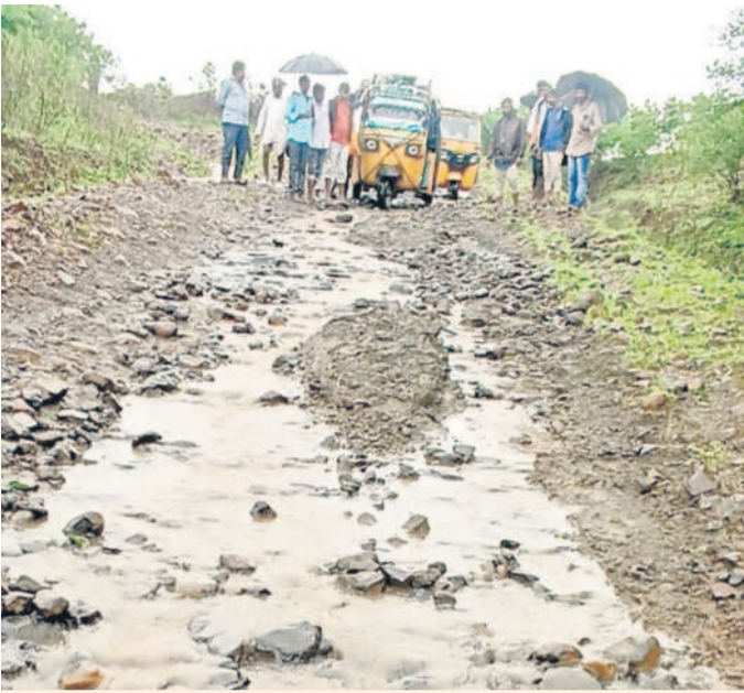
బురదలో ఆగిపోయిన వాహనాన్ని బయటికి తోస్తున్న మాదాపూర్ గ్రామస్థులు