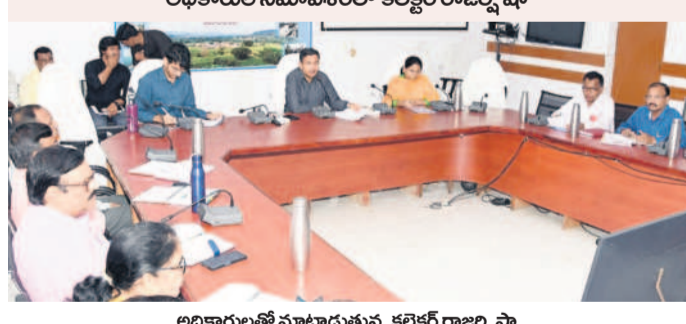
అధికారుల సమావేశంలో కలెక్టర్ రాజర్షి షా

ఎదులాపురం, ఆగస్టు 8 : స్వాతంత్ర్య వేడుకలకు పకడ్బందీగా ఏర్పాట్లు చేయాలని కలెక్టర్ రాజర్షి షా అధికారులను ఆదేశించారు. గురువారం కలెక్టరేట్ సమావేశ మందిరంలో ఏర్పాటు చేసిన స్వాతంత్ర్య వేడుకలపై సమావేశం నిర్వహించారు. ఈ సందర్భంగా ఆయన మాట్లాడుతూ.. వేడుకలకు చేపట్టాల్సిన కార్యక్రమాల గురించి ఆయా శాఖలవారీగా అధికారులకు దిశానిర్దేశం చేశారు. అదే పోలీస్ పరేడ్ గ్రౌండ్లో వేడుకలను నిర్వహించనున్నందున పక్కా ఏర్పాట్లు చేయాలని