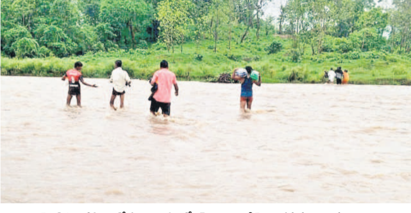
వంతెన కొట్టుకుపోవడంతో ప్రమాదకర స్థితిలో కడం వాగు దాటి వెళ్తున్న పనుల గ్రామస్థులు

ఆదిలాబాద్ జిల్లా ఇండ్రవెల్లి మండలంలోని చిత్రబ్రహ్మ గ్రామంలో 52 కుటుంబాలు 300లకు పైగా జనాభా ఉంది. గౌరవూర్ పంచాయతీ పరిధిలోని ఈ గిరిజన గ్రామానికి వెళ్లే దారిలో కిలోమీటరు వరకు రోడ్డు బాగా లేదు. దీనికి తోడు ఇదే మార్గంలో వాగు ఉంది. వర్షాలలో వాగు పొంగి ప్రవాహవంతో ప్రజలు తమ అవసరాల కోసం బయటకు వెళ్లాలంటే ప్రమాదకర పరిస్థితుల్లో వాగు దాటాలి. భారీ వర్షాల పడితే వాగుల ఉద్ధృతి పెరిగి దాటలేని దుస్థితి. రేపేన సరుకుల కోసం కిలోమీటరు గౌరవూర్, వైద్యం కోసం మూడు కిలోమీటరు డనోరా సబ్ సెంటరుకు వెళ్లక తప్పని పరిస్థితి. దీంతో వానకాలం రెండు నెలలపాటు ఈ గ్రామాల ప్రజలు ప్రమాదకర పరిస్థితుల్లో వాగు దాటక తప్పడం లేదు.