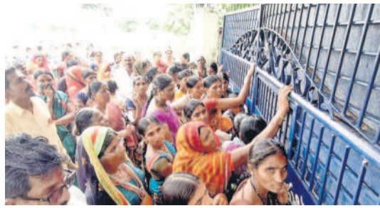
నిరసన తెలుపుతున్న తల్లిదండ్రులు

ఖైసా, ఆగస్టు 8 : ఖైసా పట్టణంలోని ప్రభుత్వ ఆశ్రమ బాలికల పాఠశాల ఎదుట నాగుల పంచమికి సెలవు ఇవ్వాలని కోరుతూ గురువారం విద్యార్థుల తల్లిదండ్రులు నిరసన చేపట్టారు. ఈ విషయంపై ప్రిన్సిపాల్ స్పష్టమంజూల మాట్లాడుతూ.. శుక్రవారం ఆదివాసీ దినోత్సవం ఉన్నందున పాఠశాలకు సెలవు ఇవ్వడం కుదరదని, తల్లిదండ్రులు విద్యార్థులతో మాట్లాడి వెళ్లిపోవాలని సూచించారు. దీంతో విద్యార్థులతో మాట్లాడి తల్లిదండ్రులు వెళ్లిపోయారు.