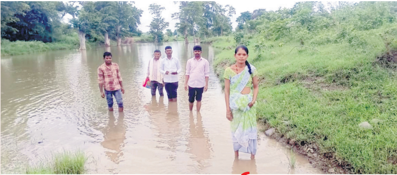
ప్రవాహంలో నుంచే వాగు దాటుతున్న చిత్రబ్రహ్మ గ్రామస్థులు