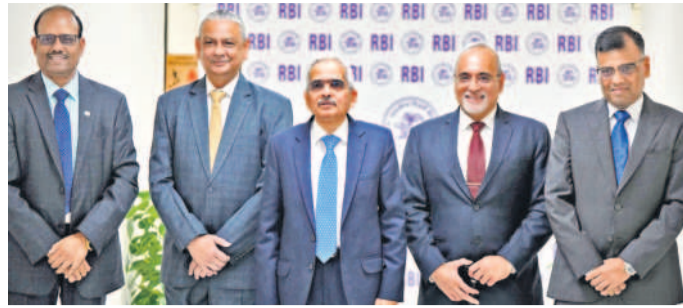
గురువారం ముంబైలోని ఆర్బీఐ ప్రధాన కార్యాలయంలో ద్రవ్యసమీక్ష సందర్భంగా డిప్యూటీ గవర్నర్తో ఆర్బీఐ గవర్నర్ శక్తికాంత దాస్