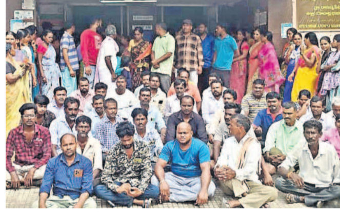
రామన్నపేట కమ్యూనిటీ హాల్ సెంటర్ ఎదుట ఆందోళన చేస్తున్న మానవ కుటుంబ సభ్యులు