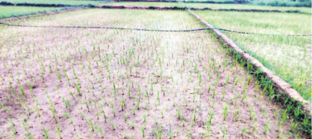
మోతూరులో సాగునీరు అందక ఎండిపోతున్న వరి పొలం

గోదావరి జలాలు అందక అవస్థలు పలు మండలాల్లో సాగు నీటికి కష్టాలు సాగుకు రైతన్నల వెనుకడుగు ఎండిన చెరువులు.. అడుగుంటిన భూగర్భ జలాలు వర్షాలూ అంతంత.. కొత్త బోర్ల వైపు బాటలు కాళేశ్వరం జలాల కోసం ఆశగా ఎదురుచూపు