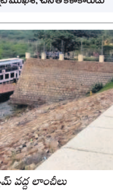
ఎర్త్ డ్యామ్ వద్ద లాంచీ స్టేషన్

అల్లుతూ రెండేండ్లు శ్రమించి చీరను సిద్ధం చేశాడు. 46 అంగుళాల వెడల్పు, ఏడు మీటర్ల పొడవుతో 600 గ్రామాల తేలికైన చీరను నేశాడు. అందులో పూల మొగ్గలు, విరబాసిన పువ్వులు, సూర్యుడు, చందమామ, స్వస్తి, విక్టరీ సింబల్, క్యారెంట్ బోర్డు వంటి దాదాపు 100 రకాల డిజైన్లు చేశాడు.