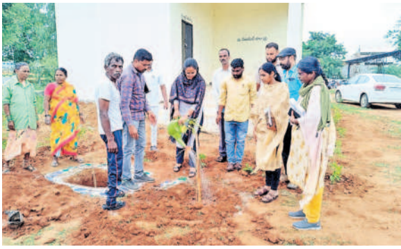
వైకుంఠధామం వద్ద మొక్క నాటి నీరు పోస్తున్న అదనపు కలెక్టర్ ప్రతిమాసింగ్