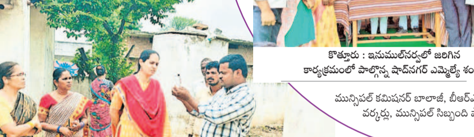
కొత్తూరు : ఇనుములేనర్వల్లో జలగిరి కార్యక్రమంలో పాల్గొన్న షాదీన్ గర్ ఎమ్మెల్యే శంకర్

యాచారం : వాటర్ ట్యాంకులను ఎప్పటికప్పుడు శుభ్రం చేసుకోవాలని మండల పంచాయతీ అధికారి శ్రీలత సూచించారు. స్వచ్ఛదనం-పచ్చదనం కార్యక్రమంలో భాగంగా మంగళవారం ప్రతి గ్రామంలోనూ అధికారుల పర్యవేక్షణలో పంచాయతీ సిబ్బంది వాటర్ ట్యాంకులను శుభ్రపరచారు. గ్రామాల్లో నీటి స్వచ్ఛతను ఎంపీవో శ్రీలత సమక్షంలో అధికారులు పరిశీలించారు. అనంతరం వనమహోత్సవంలో భాగంగా మొక్కలు నాటారు. కార్యక్రమంలో పంచాయతీ కార్యదర్శులు, అంగన్వాడీ వర్కర్లు, పంచాయతీ సిబ్బంది, ఈజీఎస్ సిబ్బంది పాల్గొన్నారు.