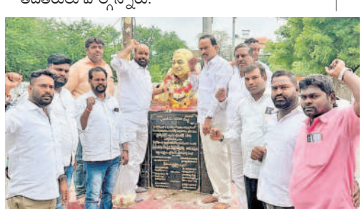
డౌటన్ బజార్ చౌరస్తాలో సార్ విగ్రహనికి పూల మాల వేసి

కలిసి పూలమాల వేసి నివాశులర్పించారు.ఈ కార్యక