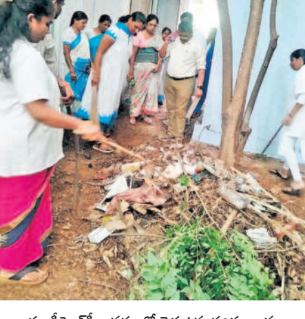
యూపీహెచ్సీ ఆవరణలో చెత్త ఉన్న పరిసరాలను పరిశీలిస్తున్న డీఎంహో డాక్టర్ వెంకటి

పరిసరాల పరిశుభ్రత మన భాధ్యత జీహెచ్ఎంసీ ద్వారా వారం రోజులపాటు 'పచ్చదనం–స్వచ్చ