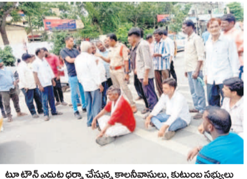
టూ టౌన్ ఎదుట ధర్నా చేస్తున్న కాలనీవాసులు, కుటుంబ సభ్యులు

ఎదులాపురం, ఆగస్టు 5 : జిల్లా కేంద్రంలోని తిర్పెల్లి కాలనీ సమీపంలో ఆదివారం అర్ధరాత్రి గుర్తు తెలియని వాహనం డిక్షానడంలో సంద విలత్ తీవ్రంగా గాయపడ్డాడు. స్థానికులు వెంటనే రిమ్స్ కు తరలించారు. చికిత్స పొందు తూ సోమవారం ఉదయం మృతి చెందారు. దీంతో యువకుడు నివసిస్తున్న కాలనీవాసులు యువకుడిని డీ కాట్టి వెళ్లిన గుర్తు తెలియని వాహనాన్ని గుర్తించాలని పోలీసులకు ఫిర్యాదు చేశారు. వికల్ప వికలాంగుడైన నాన్న, వృద్ధురాలైన అమ్మతోపాటు భార్య, ఇద్దరు కూతురు ఉన్నారు. ఒక్కగానొక్క కొడుకు మృతి చెందడంతో ఆ కుటుంబం రోడ్డున పడిందని, వారిని అదుకోవాలని పోలీసులను కాల