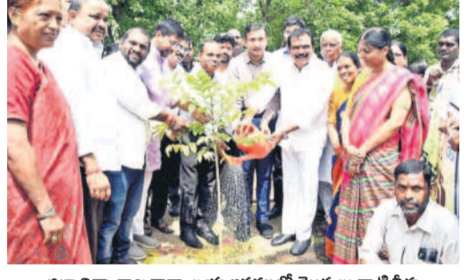
జిల్లా విద్యాశాఖ కార్యాలయ ఆవరణలో మొక్కలు నాటిన కలెక్టర్, ఎమ్మెల్యే

విద్యాశాఖ కార్యాలయ ఆవరణలో మొక్కలు నాటిన కలెక్టర్, ఎమ్మెల్యే