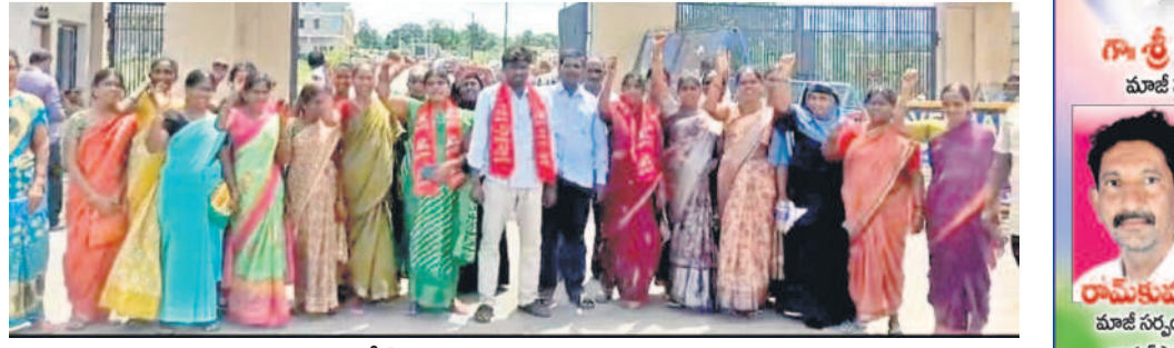
కలెక్టరేట్ ఎదుట నిరసన తెలుపుతున్న కార్మికులు

మంజూరు చేయాలని, ప్రభుత్వం మధ్యాహ్న భోజన పథకాన్ని ప్రైవేటు సంస్థకు అప్పజెప్పడాన్ని వెంటనే విరమించుకోవాలని డిమాండ్ చేశారు. లేనిచేత 18న మండల కేంద్రాలు, 21న హైదరాబాద్ ముట్టడి చేపడుతామన్నారు.