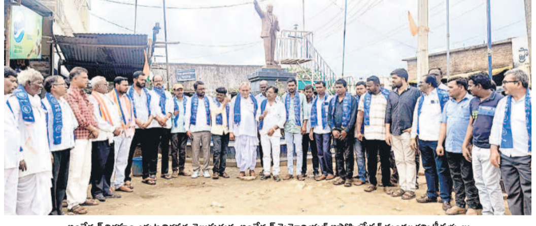
అంబేద్కర్ విగ్రహం ఎదుట నిరసన తెలుపుతున్న అంబేద్కర్ మెమోరియల్ అసోసియేషన్ మండల కమిటీ సభ్యులు