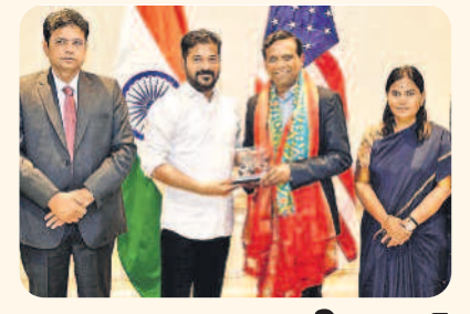
విస్తరణ దిశగా కాగ్నీజైంట్

నెల గడిచింది.. మరో 3 నెలలైనా ఇంతేనా? కేసు కొలిక్కివచ్చేవరకూ నిర్ణయం తీసుకోరా? ఫిరాయింపులపై ఏజెన్సీ ప్రశ్నించిన హైకోర్టు హైదరాబాద్, ఆగస్టు 5 (నమస్తే తెలంగాణ): పార్టీ ఫిరాయింపులకు పాల్పడిన ఎమ్మెల్యేల విషయంలో చర్యలు లేకపోవడంపై రాష్ట్ర హైకోర్టు తీవ్రంగా స్పందించింది. పార్టీ ఫిరాయింపులపై ఎమ్మెల్యేలపై చర్యలకు తాము ఆదేశాలు జారీచేసే వరకు స్పీకర్ నిర్ణయం తీసుకోరా? అని ఆద్యక్షేట్ జనరల్స్ ప్రశ్నించింది. నెలల కాలం గడిచిపోయినదని, అయినా స్పీకర్ ఎందుకు నిర్ణయం తీసుకోలేదని ఏజెన్సీ నిలదీసింది. కోర్టు ఆదేశాలు ఇప్పటికే పిటిషన్లపై > 2వ పేజీలో