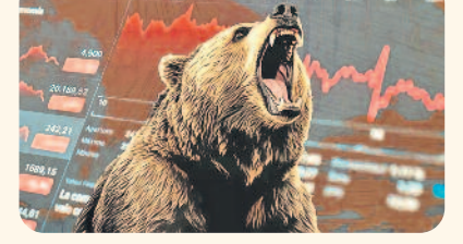
నిండా ముంచిన బ్ల్యాక్ మండ్

వరంగల్, ఆగస్టు 5 (నమస్తే తెలంగాణ ప్రతినంది): ఎంబీబీఎస్, బీదీఎస్ అడ్మిషన్లలో రాష్ట్ర ప్రభుత్వం కొత్తగా తెచ్చిన నిబంధనలు తెలంగాణ విద్యార్థులకు అన్యాయం చేసేలా ఉన్నాయి. స్థానికతపై రాష్ట్ర ప్రభుత్వం తాజాగా ఇచ్చిన ఉత్తర్వులతో తెలంగాణ పట్టణలకు స్వల్పం జరుగుతున్నది. ఎంబీబీఎస్, బీదీఎస్ కోర్సుల్లో అడ్మిషన్ల కోసం కాలోజీ నారాయణరావు యూనివర్సిటీ ఆఫ్ హెల్త్ సైన్సెస్ ఈ నెల 3న నోటిఫికేషన్ జారీ చేసింది. ఉమ్మడి ఆంధ్రప్రదేశ్ పునర్విభజన చట్టం ప్రకారం విద్యా సంస్థల అడ్మిషన్లలో 2014 నుంచి 2024 వరకు ఆంధ్రప్రదేశ్ విద్యార్థులకు కోటా ఉన్నది. ఈ చట్టంలో పేర్కొన్న గడువు ముగిసిన నేపథ్యంలో తాజా అడ్మిషన్ ప్రక్రియ కోసం కాలోజీ హెల్త్ యూనివర్సిటీ మార్గదర్శకాలు విడుదల చేసింది. స్థానికత నిర్ధారణపై గతంలో ఉన్న నిబంధనల్లో మార్పులు చేసింది. రాష్ట్ర ప్రభుత్వం జూలై 19న జారీ చేసిన 38జీవో ప్రకారం స్థానికత నిబంధనలను పేర్కొన్నట్లు తెలిసింది. ఈ నిబంధనలతో అన్యాయం జరిగేలా ఉన్నదని స్థానిక విద్యార్థులు ఆందోళన వ్యక్తం చేస్తున్నారు. 9వ తరగతి > 6వ పేజీలో