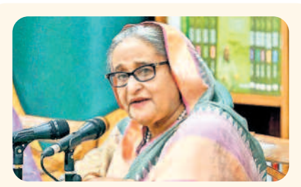
బంగ్లా షేక్.. హాసీనా టెట్

అప్ప కట్టించుకోని బ్యాంకులు! 2 లక్షలకుపైగా రుణం ఉన్న రైతులకు కొత్త బిక్కు అప్ప మొత్తం చెల్లిస్తేనే మాఫీ చేస్తామని సర్కార్ మెలిక అప్పో సప్పో చేసి చెల్లింపులకు సిద్ధమవుతున్న రైతులు ఇప్పుడు అక్కరలేదంటున్న బ్యాంకు అధికారులు దిక్కుతోచని స్థితిలో రైతులు > 2