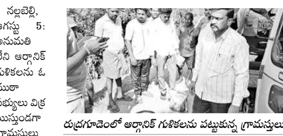
రుద్రగూడెంలో ఆర్డర్ల గుళికలను పట్టుకున్న గ్రామస్తులు

పట్టుకొని పోలీసులకు అప్పగించిన గ్రామస్తులు