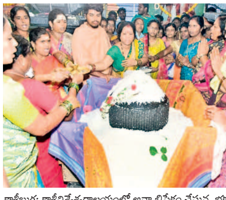
శాఖిబుగ్గ: శాఖివిశ్వేశ్వరాలయంలో అన్నాభిషేకం చేస్తున్న భక్తులు

ఆలయాల శ్రావణ శోభను సంతరించుకున్నాయి. శ్రావణ మాసం మొదటి సోమవారం సందర్భంగా పెద్ద ఎత్తున భక్తులు తరిలివచ్చి దేవతామూర్తులకు పూజలు చేశారు. హనుమకొండలోని చారిత్రక మొన్నంబాల రుద్రేశ్వరస్వామి దేవాలయంలో రుద్రేశ్వర స్వామికి 200 మంది దంపతులతో సామాహిక రుద్రాభిషేకాలు నిర్వహించారు. 51 కిలోల పెరుగుంతో అన్నాభిషేకం చేసినందుకు మున్న పూజ చేశారు. గణపేశ్వరుడు కౌటగుళ్లలోని నందిశ్వరుడు, గణపేశ్వరుడికి పంచామృతాలతో రుద్రాభిషేకం నిర్వహించారు. వరంగల్ స్టేషన్ రోడ్ లోని ఆకారపు వారి గుడిలోని కాశీ విశ్వేశ్వరస్వామివారికి వేద మంత్రోచ్ఛారణతో లక్ష్మిబాహుళ్యం నిర్వహించారు. కాశీబుగ్గలోని కాశీవిశ్వేశ్వరుడికి 39 బీటర్లతో పాలాభిషేకం చేశారు.