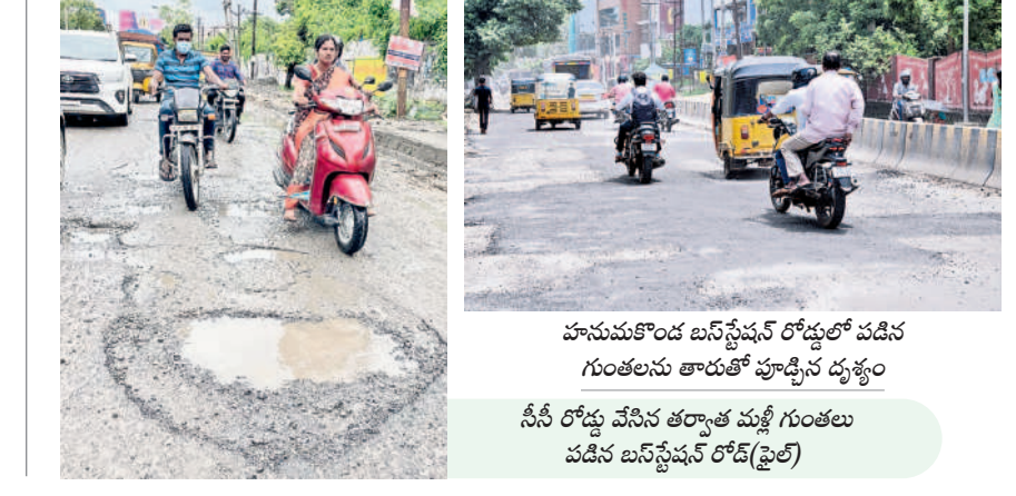
హనుమకొండ బస్ స్టాండ్ రోడ్డులో పడిన గుంటులను తారుతో పూడ్చిన దృశ్యం

సీసీ రోడ్డు వేసిన తర్వాత మళ్ళీ గుంటుల పడిన బస్ స్టాండ్ రోడ్డులో