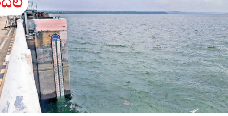
నిండుకుండలా నాగార్జునసాగర్ రిజర్వాయర్

సంద్కోండ, ఆగస్టు 4 : నాగార్జున సాగర్ రిజర్వాయర్ కు ఇన్ ఫ్లో భారీగా పెరుగుతో నీరునుండి మారినది. జూలై 25 నుంచి నాగార్జునసాగర్ కు త్రీశైలం రిజర్వాయర్ నుంచి ఇన్ ఫ్లో ప్రారంభం కాగా 503 అడుగుల నుంచి క్రమంగా నీటి మట్టం పెరుగుతూ వచ్చింది. 15 రోజుల్లోనే 574.90 (268.86టీఎంసీలు) అడుగులకు చేరింది. ప్రాజెక్టు పూర్తి స్థాయి నీటిమట్టం 590 అడుగులకునూ ఇంకా 15 (44 టీఎంసీలు) అడుగులు మాత్రమే నిండాల్సి ఉన్నది. ప్రస్తుతం త్రీశైలం ద్వారా 10 క్రస్ట్ గేట్లు, జల విద్యుత్ కేంద్రాల ద్వారా 3,21,873 క్యూసెక్కుల ఇన్ ఫ్లో సాగర్ కు వచ్చి చేరుతున్నది. రోజుకు 27 టీఎంసీల వాటాను పంపిణీ చేస్తుండడంతో మరో రెండు రోజుల్లో ప్రాజెక్టు పూర్తిస్థాయిలో నిండనుంది. రిజర్వాయర్ నీటి మట్టం 580 అడుగులకు చేరగానే ద్వారా క్రస్ట్ గేట్ల ద్వారా దిగువకు నీటిని విడుదల చేస్తారు. ద్వారా క్రస్ట్ గేట్లను సోమవారం వచ్చి దిగువకు నీటిని విడుదల చేయడానికి ఎన్నెన్నో అధికారులు ఏర్పాట్లు చేస్తున్నారు. రిజర్వాయర్ కు మొత్తం 3,21,873 క్యూసెక్కుల ఇన్ ఫ్లో, 37,873 క్యూసెక్కుల అవుట్ ఫ్లో కొనసాగుతున్నది. ప్రస్తుతం కుడి కాల్వ ద్వారా 5,700, ఎడమ కాల్వ ద్వారా 4,613 క్యూసెక్కులు, ఎన్ ఎల్ టీసీ ద్వారా 1,200, వరద