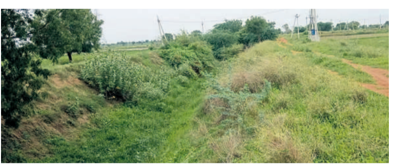
మాధులపల్లి మండలం తోపుర్ర గ్రామ సమీపంలో కంపెట్టెట్లో ఉన్న వరద కాల్వ