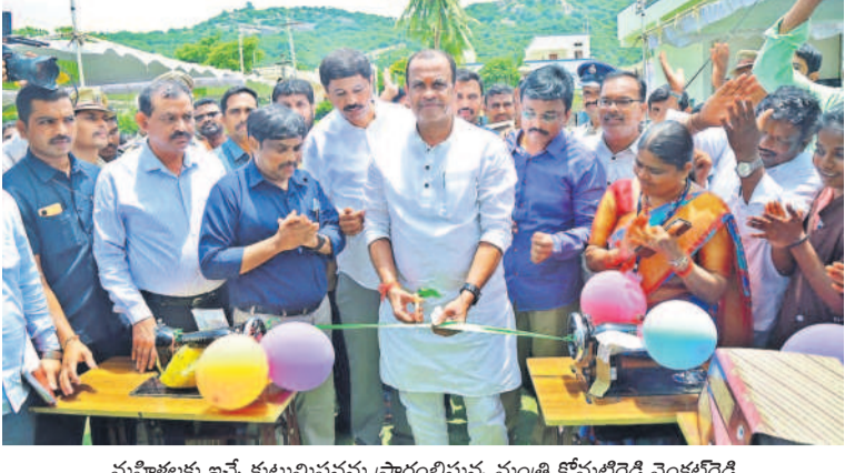
మహిళలకు ఇచ్చే కట్టుబడిన ప్రారంభిస్తున్న మంత్రి కోమటిరెడ్డి వెంకటరెడ్డి