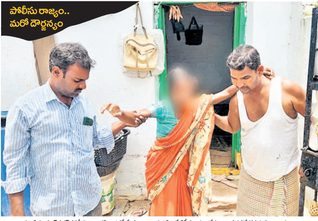
వారం శ్రీతం షాద్ నగర్ పోలీసుల చిత్రహింసల్లో తీవ్రంగా గాయపడి.. నేటికీ సాయం లేకుండా నడవలేకపోతున్న బాధితురాలు