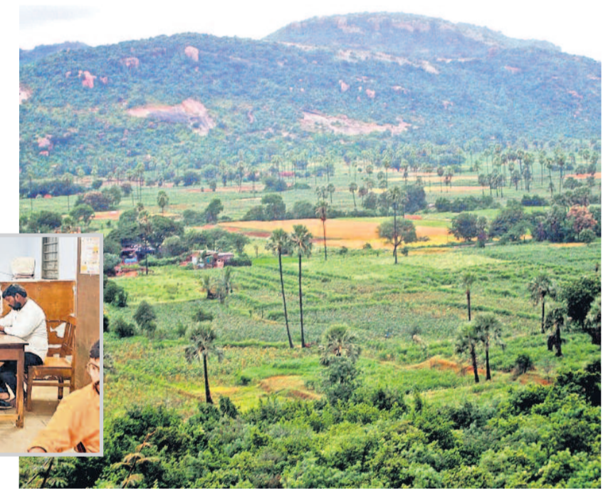
రాచకొండ గుట్టల్లో భూముల డబుల్ రిజిస్ట్రేషన్ వివాదానికి మంచాల తహసీల్ కార్యాలయం కేంద్రబిందువుగా ఉన్నది. తహసీల్ కార్యాలయం రియల్ ఎస్టేట్ వ్యాపారులు, దళారులకు అడ్డాగా మారింది. కార్యాలయంలో ఓ రెవెన్యూ అధికారి కుర్చీలో కూర్చున్న వైచిత్రీని చిత్రహింసలో చూడొచ్చు.

ఎకరం 60 లక్షలకు పైనే ధర 15 లక్షలకే విక్రయం