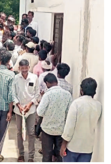
పాలకుర్తి : యూరియా కోసం రైతు సహకార సంఘం వద్ద క్యూలైన్లో ఉన్న రైతులు