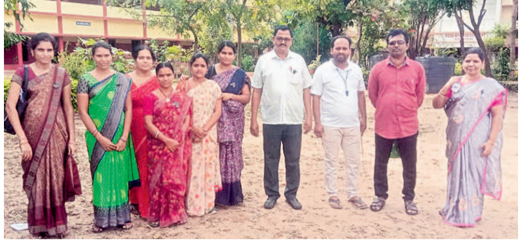
మంగళం : నిరసన వ్యక్తం చేస్తున్న ఆర్ఎంసీ పాఠశాల ఉపాధ్యాయులు

- మామిడి వృత్తి, ప్రైవేట్ పాఠశాల నిర్వాహకులు