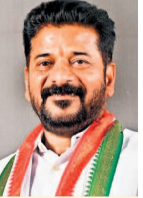
పాఠాలు చెప్పే మాకు మీర్చి గౌరవం ఇదేనా?

ముఖ్యమంత్రి రేవంత్ రెడ్డి తీరుపై ప్రైవేట్ టీవర్లు భగ్గుమన్నారు. 'ఇంటర్ పాసైన వాళ్లు.. డిగ్రీ ఫెయిల్ అయిన వాళ్లు ప్రైవేట్ స్కూళ్లలో బోధిస్తున్నారు గీతీ అంటే ఒక సరిలో అనుచిత వ్యాఖ్యలు చేయడంపై ఆగ్రహం వ్యక్తం చేస్తున్నారు. విద్యార్థులకు పాఠాలు బోధించే టీవర్లకు మీర్చి గౌరవం ఇదేనా? ఇదేనా మీ సంస్కారం అంటూ ప్రశ్నిస్తున్నారు. ఎంతోమంది డిగ్రీలు, పీజీలు చేసి ప్రభుత్వ ఉద్యోగం దొరకక ఇంటిచాలని వేతనాలతో పనిచేస్తుంటే గౌరవం వేతనం పెంచాలి అంటూ పాఠశాలలలో చేలా మాట్లాడడమేంటి మందిపడుతున్నారు. ఈ సందర్భంగా ఉమ్మడి జిల్లాలో పలుచోట్ల సీఎం వ్యాఖ్యలను వ్యతిరేకించగా ములుగు జిల్లా మంగళం కమలాపురంలోని ఆర్ఎంసీ పాఠశాలలో శనివారం నల్లబ్యాండ్లు ధరించి నిరసన తెలిపారు. తమ మనోభావాలను దెబ్బ తీసేలా మాట్లాడిన ముఖ్యమంత్రి రేవంత్ రెడ్డి వెంటనే క్షమాపణ చెప్పాలని నిరూపించాలి.