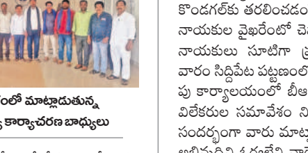
సమావేశంలో మాట్లాడుతున్న మూలల ఇక్కడ కార్యక్రమం కమిటీ