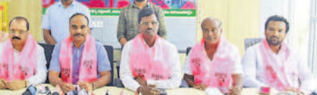
మాట్లాడుతున్న బీఆర్ఎస్ నాయకులు

■ సిద్దిపేటకు వస్తే నిధులతో రావాలి ■ రాజనామాలు బీఆర్ఎస్ కి కొత్త కాదు..