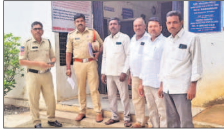
దుబ్బాక: దుబ్బాక పోలీసు స్టేషన్లో మాజీ సర్పంచులు