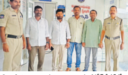
కొండపాక(కుకునూరుపల్లి): కుకునూరుపల్లి పోలీసు స్టేషన్లో ఉమ్మడి కొండపాక మండల మాజీ సర్పంచులు