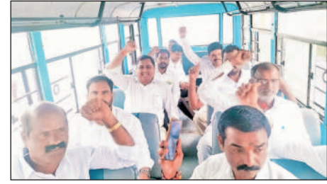
సిద్దిపేట: హైదరాబాద్లో పోలీసులు అధిష్టించిన మాజీ సర్పంచులు