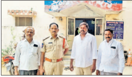
మద్దూరు(ధూళిమట్ట): సర్పంచులను అధిష్టించిన ఏసీబీ, జగితలూర్

లోక సమావేశం నిర్వహించారు. ఈ సందర్భంగా కలెక్టర్ మాట్లాడుతూ పారిశుధ్య కార్యక్రమాలను ముమ్మరం చేసేందుకు ప్రజలను పెద్ద ఎత్తున భాగస్వాములను చేయాలన్నారు.