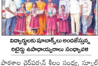
విద్యార్థులకు భూభాగ్యాల అందజేస్తున్న లిద్దరు ఉపాధ్యక్షులు సందర్శన

హుస్సేనాబాద్, ఆగస్టు 2: పడుపుకునే పేద విద్యార్థులకు సహాయం అందించే గొప్ప వ్యక్తి లిద్దరు ఉపాధ్యక్షులు ముంబై సందర్శన కోసం వెళ్తున్నారని తెలుస్తోంది. స్థానిక ప్రభుత్వ ప్రాథమిక పాఠశాలకు చెందిన 185 మంది విద్యార్థులకు శుక్రవారం ముంబై వద్ద ప్రాథమిక జ్ఞాపకార్థం 40 కేబు మిలు వైసీపీ బిల్లును అందజేశారు.