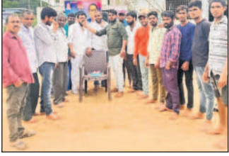
వీరనపేటలో సంబురాలు చేసేందుకు అంటే దగ్గర్ యువజన సంఘం నాయకులు

చేర్యాల, ఆగస్టు 2: ఎస్సీ వర్గీకరణకు గ్రీన్ సిగ్నల్ రావడంతో మండలంలోని వీరప్పవేటలో శుక్రవారం డాక్టర్ బీ.ఆర్.అంబేద్కర్ విగ్రహానికి నాయకులు క్షీరాభిషేకం నిర్వహించి కేకేటీటీ చేసి సంబురాలు జరుపుకొన్నారు.