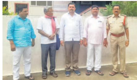
మిరుదొడ్డి: భూంపల్లి పోలీసుస్టేషన్లో మాజీ సర్పంచులు

పెండింగ్ బిల్లులు చెల్లించాలని డిమాండ్ చేస్తూ మాజీ సర్పంచులు సచివాలయం ముట్టడికి సిద్ధమవుతున్నారు. ఈ నేపథ్యంలో శుక్రవారం సచివాలయం ముట్టడికి వెళ్తున్న మాజీ సర్పంచులను జిల్లా వ్యవస్థాపక పోలీసులు అరెస్టు చేశారు.