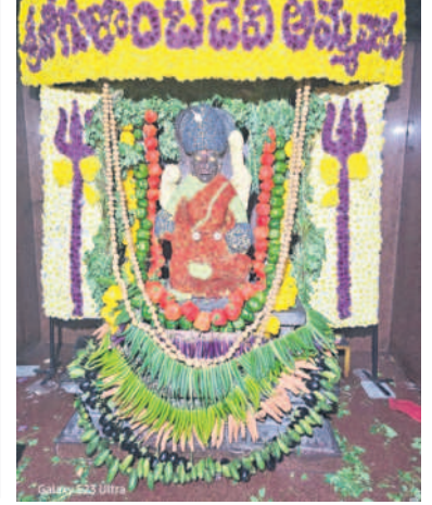
శాశాలి దేవీ శాశాలి దేవీ

అలంకారం, ఆగస్టు 2 : ఇదో శక్తి వేరంగా విరాజిల్లుతున్న అలంకారం కేంద్రంలో ఆహ్వానం చివరి శుక్రవారాన్ని పురస్కరించుకొని జోగులాంబ దేవీ శాశాలి దేవీగా భక్తులకు దర్శనమిచ్చారు. అమ్మ వారి మూల విరాట్లను కూరగాయలు, పూలతో సర్వంగా సుందరంగా అలంకరించారు. అదేవిధంగా జోగులాంబ బాలబ్రహ్మేశ్వరస్వామి అలయాలను కొబ్బరి మట్లలు, మామిడి ఆకులు, పూల తోరణాలతో అలంకరించారు. మరో వైపు బాలబ్రహ్మేశ్వరస్వామి అలయంలో ఆరుద్రోత్సవం నిర్వహించారు. శుక్రవారం తుంగభద్రానది తీరం భక్తులతో పులకం చివోయింది. సంఖ్య సమయంలో అమ్మవారి అలయంలో జోగులాంబ సహిత బాలబ్రహ్మేశ్వరస్వామి ఉత్సవ విగ్రహాలకు రథోత్సవం నిర్వహించారు.