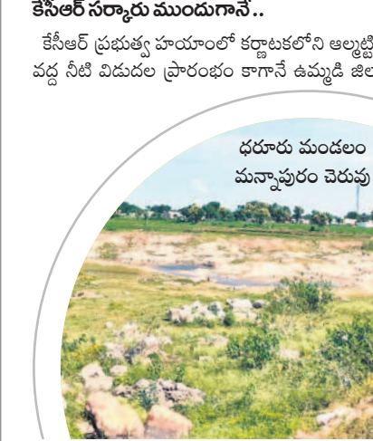
ధరూరు మండలం మనూపురం చెరువు

మహబూబ్ నగర్, ఆగస్టు 2 (నమస్తే తెలంగాణ ప్రతినిధి) : రాష్ట్ర సరిహద్దులో కృష్ణా తుంగభద్ర నదులు పరభక్తులతో కృష్ణా నీటిని పూర్తిస్థాయిలో పొందుకోలేని దుస్థితి.. సరైన సమయంలో నీటిని ఎత్తిపోతలకోసం పంపడంతో చెరువులు, వాగులు ఒట్టి బోయాాయి. దీంతో ఉమ్మడి జిల్లా రైతులు, ప్రజల ఆశలు అడుగుంటాయి. నదులు ఉప్పొంగినా ప్రయోజనమేదీ..? కర్ణాటకలో కురుస్తున్న భారీ వర్షాలకు కృష్ణానది ఉప్పొంగింది. ఈ సీజన్ లో 48 గంటల్లోనే జూలై ద్వారా, 12 రోజులకే శ్రీశైలం ప్రాజెక్టు నిండిందంటే ఎంత వేగంగా తరలివచ్చిందో అర్థం చేసుకోవచ్చు. ఎగువ నుంచి పుల్కొవడం జరిగి వస్తుండడంతో 40కిపైగా జూలై గేట్ల ద్వారా నిత్యం 3 లక్షల క్యూ సెక్కులు దిగువకు అధికారులు విడుదల చేస్తున్నారు. మరోవైపు తుంగభద్ర నదికి కూడా ఇదే స్థాయిలో వరద పొందుతున్నది. రెండు నదుల సంగమంతో తీర ప్రాంతాలు జలకళను సంతరించు కుంటే ఉమ్మడి పాలమూరు జిల్లాలో సాగునీటి కోసం రైతులు ఇబ్బందులు పడుతున్నారు. కేసీఆర్ సర్కారు ముందుగానే.. కేసీఆర్ ప్రభుత్వ హయాంలో కర్ణాటకలోని అల్పబ్లి ద్వారా వర్ష నీటి విడుదల ప్రారంభం కాగానే ఉమ్మడి జిల్లాలోని