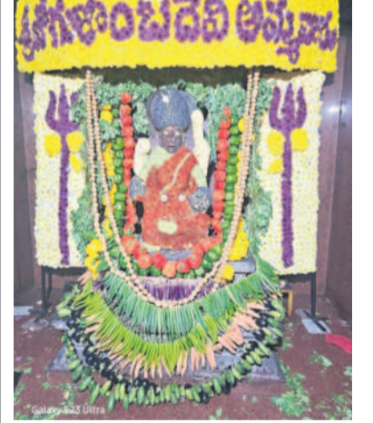
శాశాలి దేవీ శాశాలి దేవీ

అలంపూర్, ఆగస్టు 2 : ఇదే శక్తి వేరంగా విరాజిల్లుతున్న అలంపూర్ క్షేత్రంలో ఆహాహమానం చివరి శుభ్రవారాన్ని పురస్కరించుకొని జోగులాంబ దేవీ శాశాలి దేవీగా భక్తులకు దర్శనమిచ్చారు. అమ్మ వారి మూల విరాట్లను కూరగాయలు, పూలతో సర్వంగా సుందరంగా అలంకరించారు. అదేవిధంగా జోగులాంబ బాలబ్రహ్మేశ్వరస్వామి అలయాలను కొబ్బరి మట్లలు, మామిడి ఆకులు, పూల తోరణాలతో అలంకరించారు. మరో వైపు బాలబ్రహ్మేశ్వరస్వామి అలయంలో అరుణోత్సవం నిర్వహించారు. శుభ్రవారం తుంగభద్రానది తీరం భక్తులతో పులకం చివోయింది. సంధ్యా సమయంలో అమ్మవారి అలయంలో జోగులాంబ సహిత బాలబ్రహ్మేశ్వరస్వామి ఉత్సవ విగ్రహాలకు రథోత్సవం నిర్వహించారు.