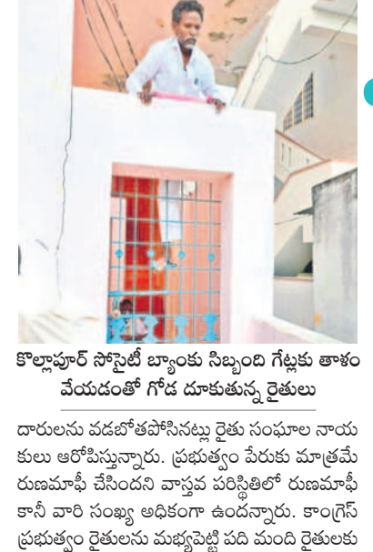
కొల్లూపూర్ సోసైటీ బ్యాంకు సిబ్బంది గేట్లు తాళం వేయడంతో గోడ దూకుతున్న రైతులు