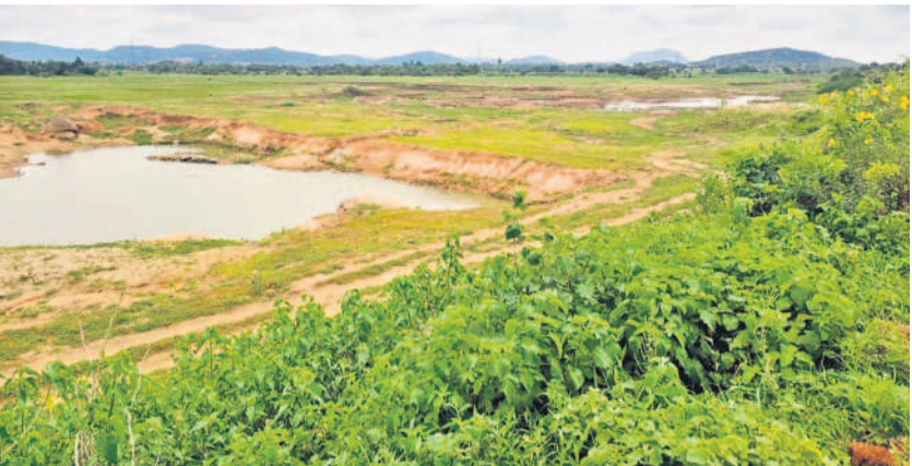
పెద్దపండ్లది : నీరులేక వెలవెలబోతున్న దోడగుంటపల్లి ఊరచెరువు